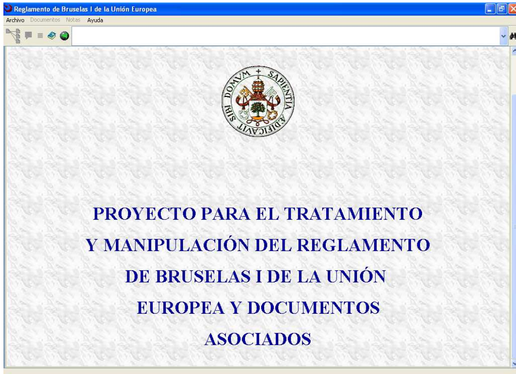
Figura 2: Captura de pantalla de la página inicial de la aplicación.