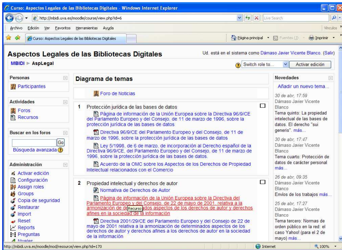
Figura 1: Captura de pantalla con el “Diagrama de temas” del curso “Aspectos Legales de las Bibliotecas Digitales”.

Como la duración del curso era de dos semanas, cada dos/tres días se comenzaba un tema y se dejaba 5 para las respuestas, de modo que finalmente los alumnos tenían plazo para responder a algunos temas un poco más allá de las dos semanas con que se contaba. Las discusiones en el foro, fomentadas a través de las preguntas, fueron desiguales y no siempre participaron todos los alumnos.