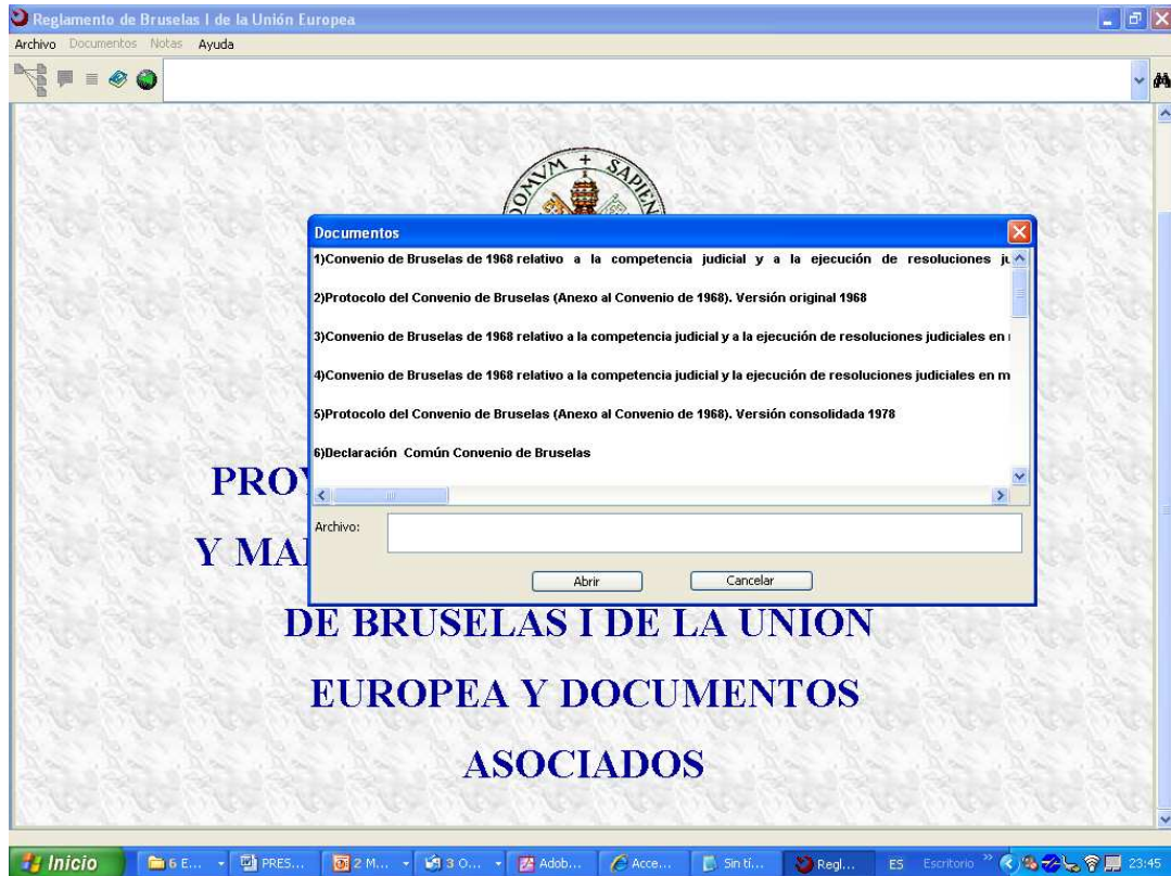
Figura 3: Captura de pantalla de la aplicación con el menú.

A tal fin se creó una herramienta docente como soporte, que cumple varias funciones. En primer lugar, facilitar a cada alumno el acceso a los textos que debe manipular para realizar su práctica, permitiéndole buscar, moverse por textos relacionados, etc. con facilidad. En segundo lugar, servir al profesor como instrumento para proporcionar a sus alumnos aquellos comentarios y materiales que quiere que utilicen en relación con cada texto o elemento legislativo.