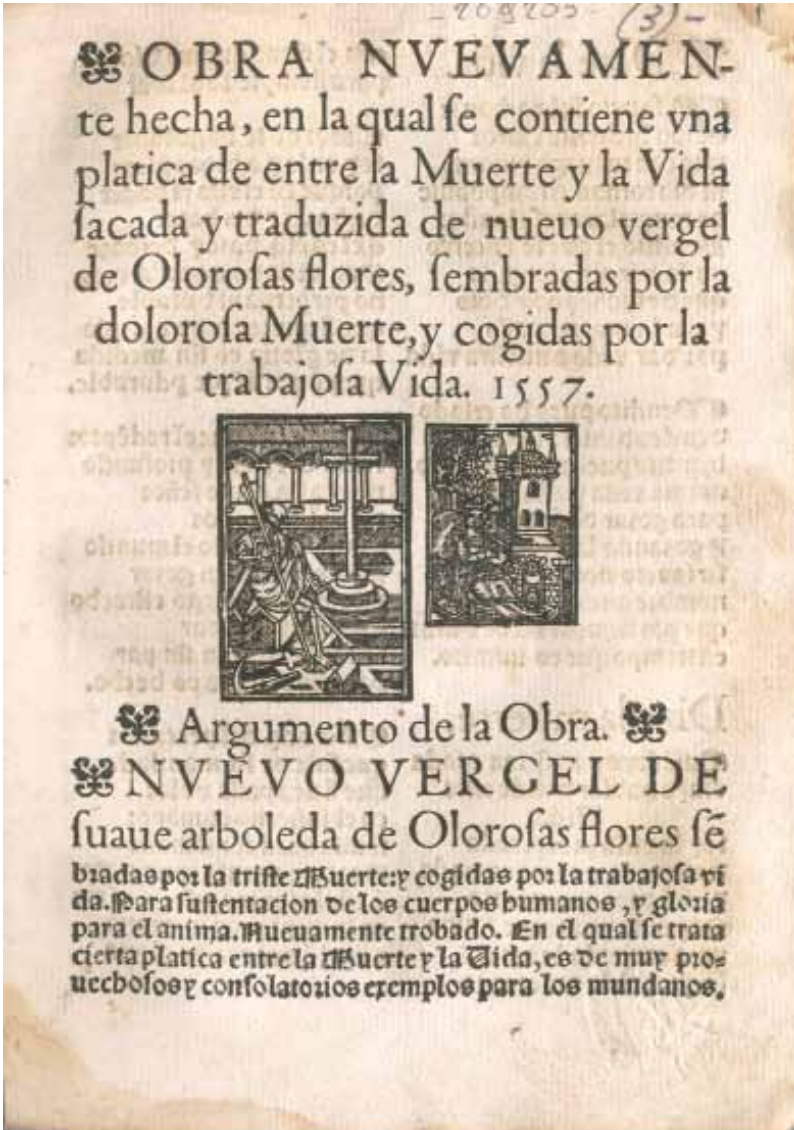
[2] Biblioteca Comunale Augusta de Perugia, [I L 1402], fol. 9