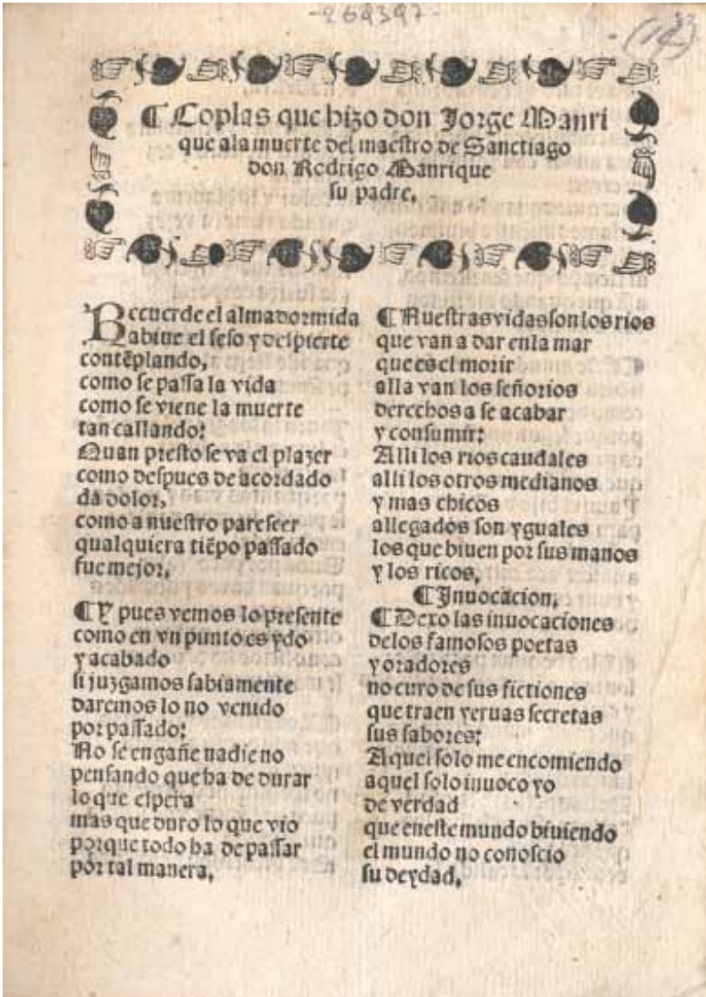
[7] Biblioteca Comunale Augusta de Perugia, [I L 1402], fol. 52