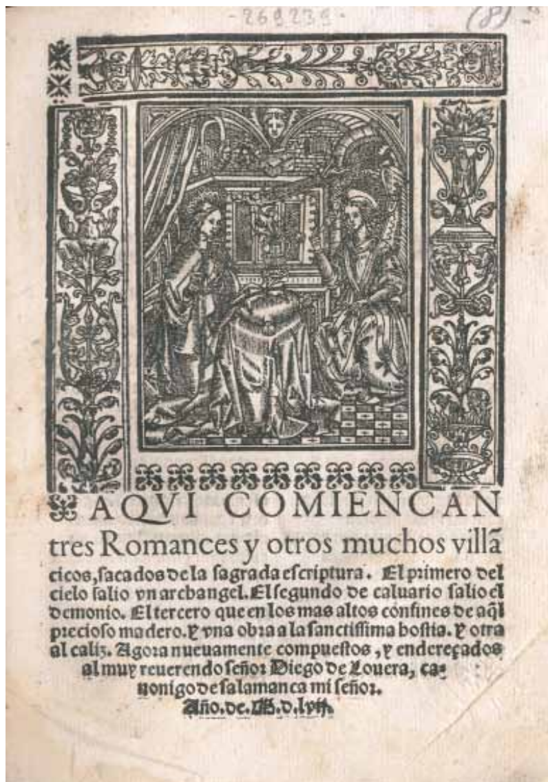
[3] Biblioteca Comunale Augusta de Perugia, [I L 1402], fol. 28