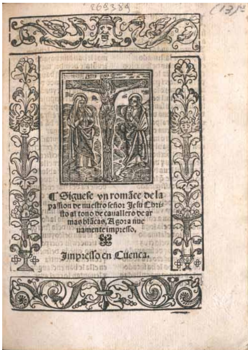
[5] Biblioteca Comunale Augusta de Perugia, [I L 1402], fol. 48