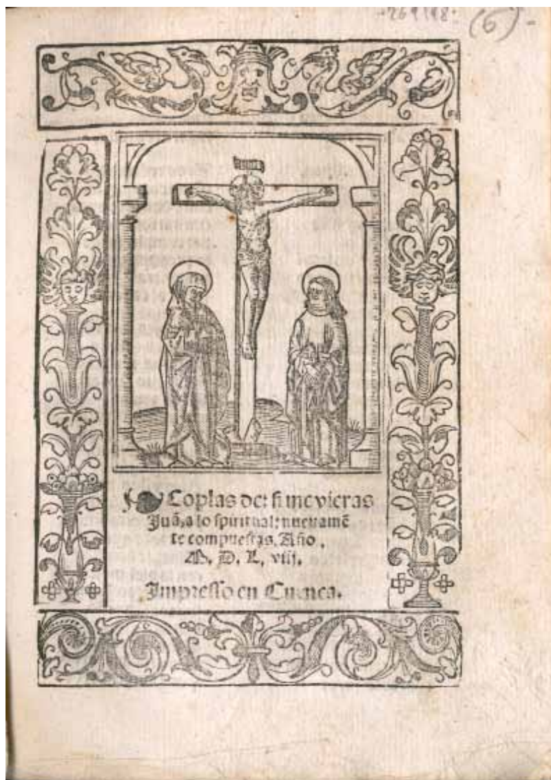
[4] Biblioteca Comunale Augusta de Perugia, [I L 1402], fol. 22