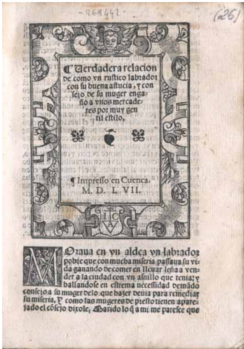
[1] Biblioteca Comunale Augusta de Perugia, [I L 1402], fol. 114