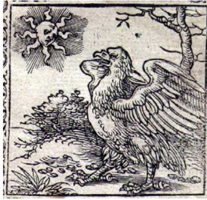
Fig. 9. Horapolo. Hieroglyphica , Paris: Kerver 1574, f. 4r ( Quid significant scribentes Aquilam ).