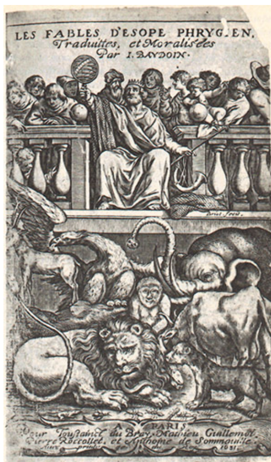
Fig. 2. Portada de las Fables d'Ésope Phrygien traduites et moralisées par I. Baudouin , París, 1631.

Para empezar con nuestro propósito de observar la línea de contacto entre fábula y emblema, puede valernos especialmente la vieja definición de Teón de que «la fábula es un discurso fingido (¿o es mejor traducirlo por «mentiroso» o «falso», para respetar la contraposición?) que da una imagen de la verdad». 11 También de dar una imagen , todavía de manera más literal, trata el emblema. Así que la trama