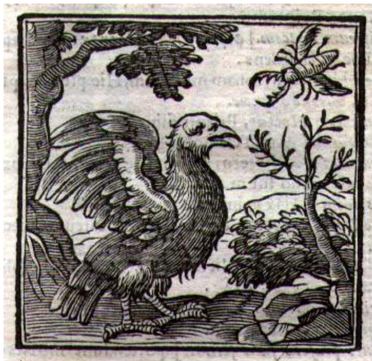
Fig. 16. Diego López, Declaración magistral de los emblemas de Andrea Alciato , Nájera: Mongastón, 1615.