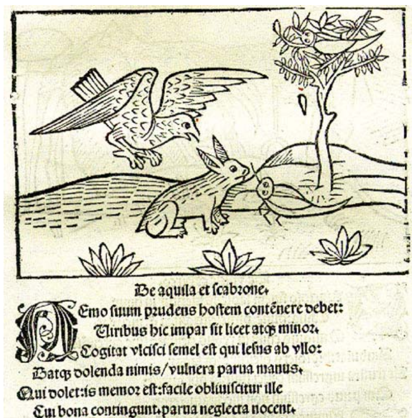
Fig. 7. Esopo, Esopi appologi sive mythologi: cum quibusdam carminum et fabularum additionibus , Basel: Jacob von Pfortzheim 1501, fol. 171r (ed. de Heinrich Steinhöwel; ils. de Sebastian Brant).

tenga que temer aun del más despreciable; que el que hoy es el más dichoso, mañana puede ser el más infeliz. Quanto mayor fueres, tanto necesitas de más. El más humilde necesita menos. Pero, por grande que seas, estás obligado a socorrer al menor». Es un desarrollo bien afinado con la ideología de Garau a lo largo de todas sus obras. No le preocupa tanto el triunfo de la justicia o la reflexión moral sobre actos buenos o malos, sino la atención a las circunstancias, a los tiempos y condicionantes en que se producen las acciones. No subraya la astucia o la perseverancia para obtener los fines sino, en negativo, la imprudencia del águila insuficientemente precavida y cautelosa ante las fuerzas oscuras del destino, insuficientemente desengañada de la vanidad de su poder, de cualquier poder mundano.