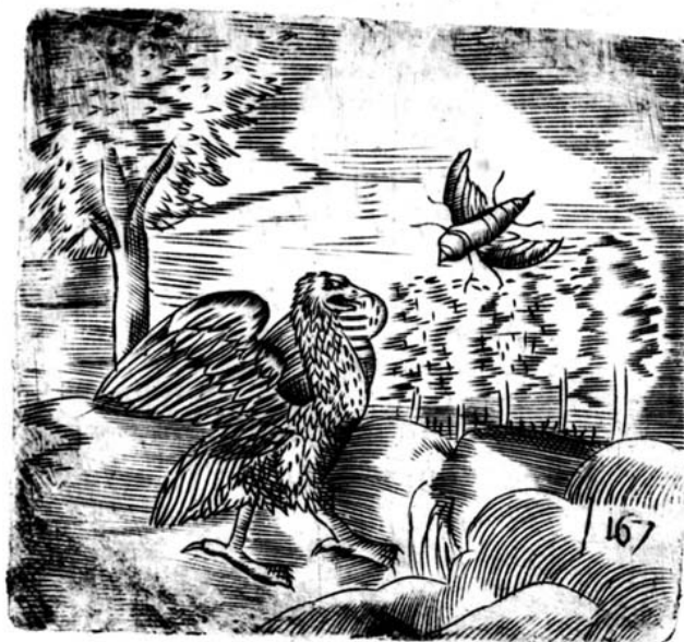
Fig. 17. Alciato, Padua: Tozzi, 1618.

Pero un rasgo interesante que queríamos destacar y que cierra nuestro análisis es que Garau, al buscar inspiración para los grabados de esa editio optima de El sabio instruido (1691) hizo derivar a todos aquellos que provienen de fábulas, claramente, de la edición ilustrada de las fábulas de Esopo hecha por Camerarius en casa del impresor Tornaesius. Y resulta que en las ilustraciones para el libro de Camerarius, Tornaesius aprovechó muchos de los grabados previamente usados en su edición de los emblemas de Alciato. Así tenemos un ejemplo de circulación completa de una imagen desde la fábula al emblema, para volver a la fábula y de nuevo al emblema, con el consiguiente enriquecimiento simbólico desde el simple relato inicial hasta su última adaptación a la retórica persuasiva, impositiva casi, 45 del complejo discurso moral barroco de un jesuita de fines del siglo XVII.