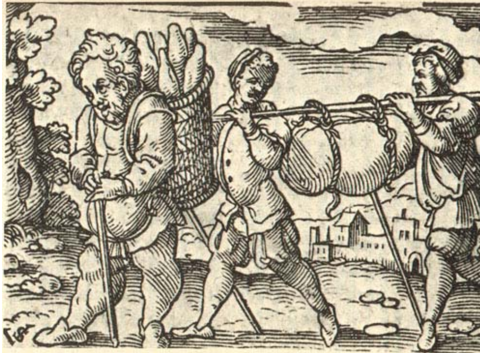
Fig. 3. Esopo llevando la cesta de pan. Nevelet, Mythologia Aesopica , Frankfurt, 1610.

Es éste un terreno que aún espera ser investigado más a fondo pero parece claro que las ilustraciones presentes en estas obras van heredando y reelaborando esquemas y topoi de la Antigüedad pudiendo remontarnos en algún caso hasta los siglos III y IV a. C. 16 Ya a inicios del siglo XII, al empezar la difusión de esta fabulística en Europa, se forma un esquema tripartito donde se incluye un elemento visual: un título (o promitio ), más una imagen que representa el clímax del relato, y luego el cuerpo de la fábula. En muchos casos, se suma al fin un comentario moral (o epimitio ). Esta disposición se fija y ofrece su modelo a otros géneros entre los cuales no podremos dejar de contar, más adelante, al emblema. Además, este arranque de la difusión de la fábula coincide con un momento clave en las relaciones de interpenetración de imagen y texto, o del signo verbal y el signo icónico, como ha apuntado, entre otros, Paul Zumthor. Así, los famosos versos de Alain de Lille (« Omnis mundi creatura / quasi liber et pictura... ») «nos prohíben disociar liber y pictura , retomados juntos en la línea siguiente por la palabra speculum (espejo). Desde este punto de vista, la escritura tiende menos, en su función primaria, a anotar las palabras pronunciadas, que a fundar una visualidad emblemática: lee, en las páginas, el universo. Éste se acuerda —aunque el pecado de Adán le haya privado de esta virtud— de haber sido el ideograma trazado por