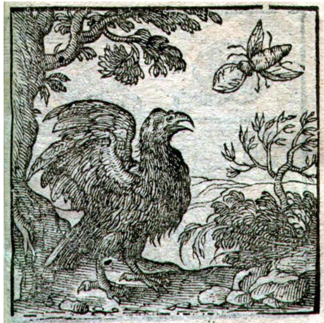
Fig. 15. Alciato, Frankfurt: Feyerabend, 1567.