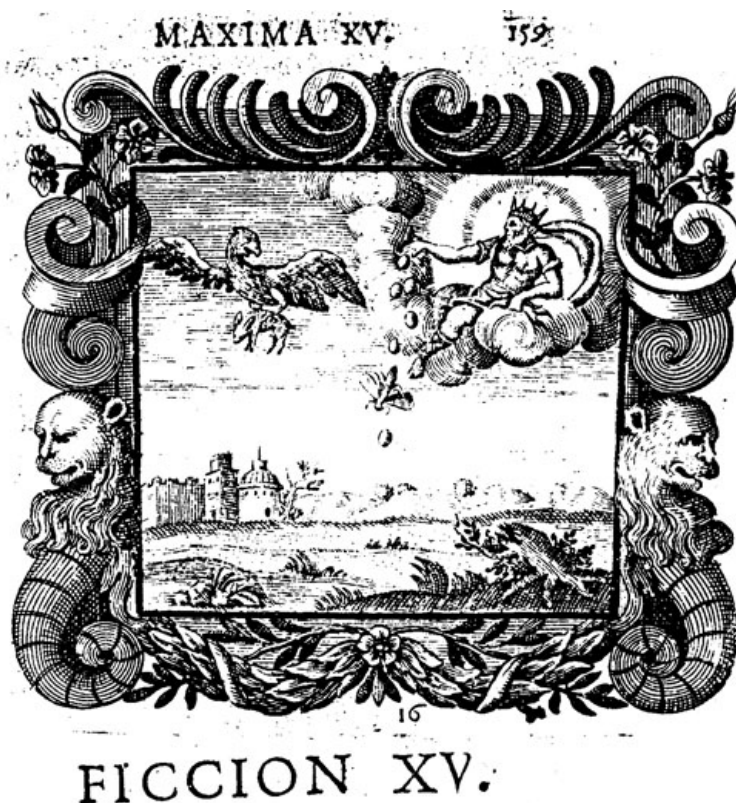
Fig. 5. Francisco Garau, El sabio instruido de la naturaleza , Valencia: Jaime de Bordazar, 1690.

visual de los vicios y virtudes, nos encontramos en un momento terminal de la exploración emblemática. Barroco y pesimista hasta los tuétanos, Garau apunta con su «Ficción» a una estructura superpuesta a la naturaleza y cuyo núcleo es el engaño. Y es obvio que la fábula clásica, con sus duras lecciones, es una elección óptima para expresar tales temas.