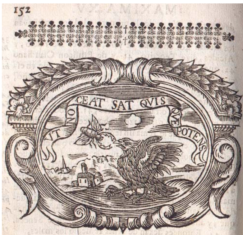
Fig. 6. Francisco Garau, El sabio instruido de la naturaleza , Barcelona: Antonio Ferrer y Baltasar Ferrer, 1691.

las súplicas de auxilio lanzadas por una liebre a punto de perecer entre las garras de un águila. El águila desprecia la intercesión del ínfimo y miserable escarabajo y devora a la liebre. La venganza del insecto será volar hasta su nido y tirarle abajo los huevos; o —en otra versión— agarrarse a sus plumas y volar así con ella hasta el regazo de Zeus, que custodia los huevos de su ave favorita, para colocar allí una bola de excremento. Al sacudirla, el dios también romperá los huevos del águila (Garau cuenta ambas versiones como dos venganzas consecutivas).