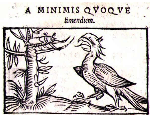
Fig. 11. Alciato, Emblematum liber , Augsburg: Steyner, 1531.

Pronto, las sucesivas ediciones de Alciato evolucionan hacia la escena de confrontación con un insólito crecimiento en tamaño y armamento del coleóptero y frente a la atónita águila.