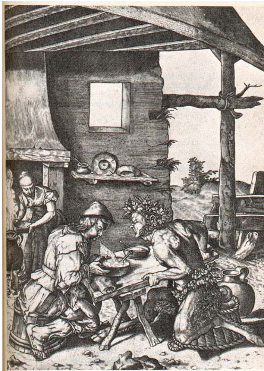
Fig. 4. El sátiro y el campesino, E. Perret, Fables des animaux , Delf, 1618.

Dios para el hombre». 17 Añade Zumthor una serie de ejemplos de este nuevo hábito de acompañar textos con imágenes y viceversa alrededor del siglo XIII, entre los que vale la pena mencionar el Bestiario de amor de Richart de Fournival que, en su prólogo justifica la presencia de ilustraciones por la necesidad de hacer presentes las cosas allí conmemoradas, dando un grado superior de inmediatez y, por tanto, de verdad al contenido del discurso escrito.