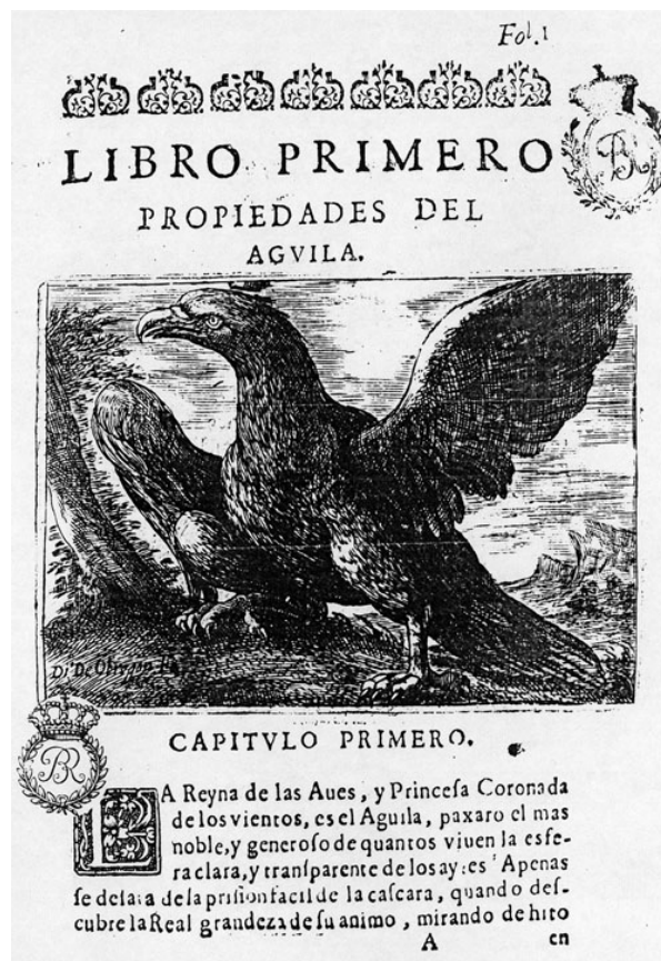
Fig. 10. Andrés Ferrer de Valdecebro, Gobierno general, moral y político hallado en las aves más generosas y nobles , Madrid: Melchor Alegre, 1670.

La conversión de esta fábula en emblema comienza con la primera edición de los emblemas de Alciato (Augsburgo, 1531, «A minimis quique [quoque] timendum»). Allí la sencillez gráfica es similar a las primeras ediciones de Esopo resaltándose, si acaso, la grandeza del águila (pero dispuesta en un plano inferior) ante el escarabajo medio camuflado en las ramas del árbol.