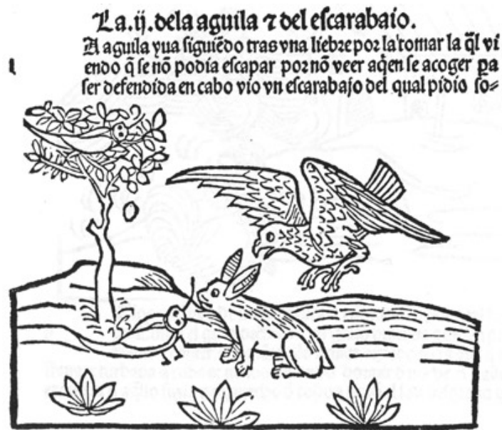
Fig. 8. Esopo, La vida del Ysopet con sus fábulas historiadas , Zaragoza: Juan Hurus, 1489 (tomado de la ed. facsímil de Madrid: RAE, 1929. Ed. de Emilio Cotarelo y Mori).