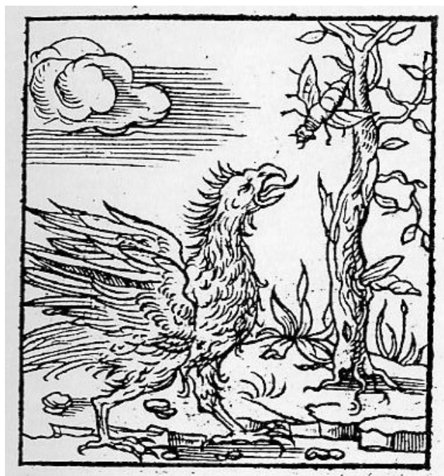
Fig. 12. Alciato. París: Wechel. 1535.

Pronto, las sucesivas ediciones de Alciato evolucionan hacia la escena de confrontación con un insólito crecimiento en tamaño y armamento del coleóptero y frente a la atónita águila.