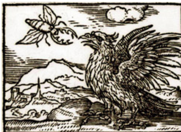
Fig. 14. Alciato, Lyon: Tornaesius, 1554.