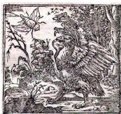
Fig. 13. Alciato, Lyon: Rouillé, 1548.

recuerdo del divulgado Adagio de Erasmo: Scarabeus aquilam quaerit 44 , cuyo discurso iba en la misma dirección. Podemos observar en las ilustraciones el recorrido sucesivo de la imagen por las ediciones de Alciato: Steyner 1531, Wechel 1535, Roville 1548 (es el mismo grabado utilizado en la traducción de Daza Pinciano, 1549), Tornaesius 1554, Feyerabend 1567 y Tozzi 1618. Como vemos, solo en contados casos, como los toscos grabados de Diego López en su Declaración magistral de los emblemas de Andrea Alciato (1615), la iconografía retrocede al escarabajo aún sin sus agresivas tenazas.