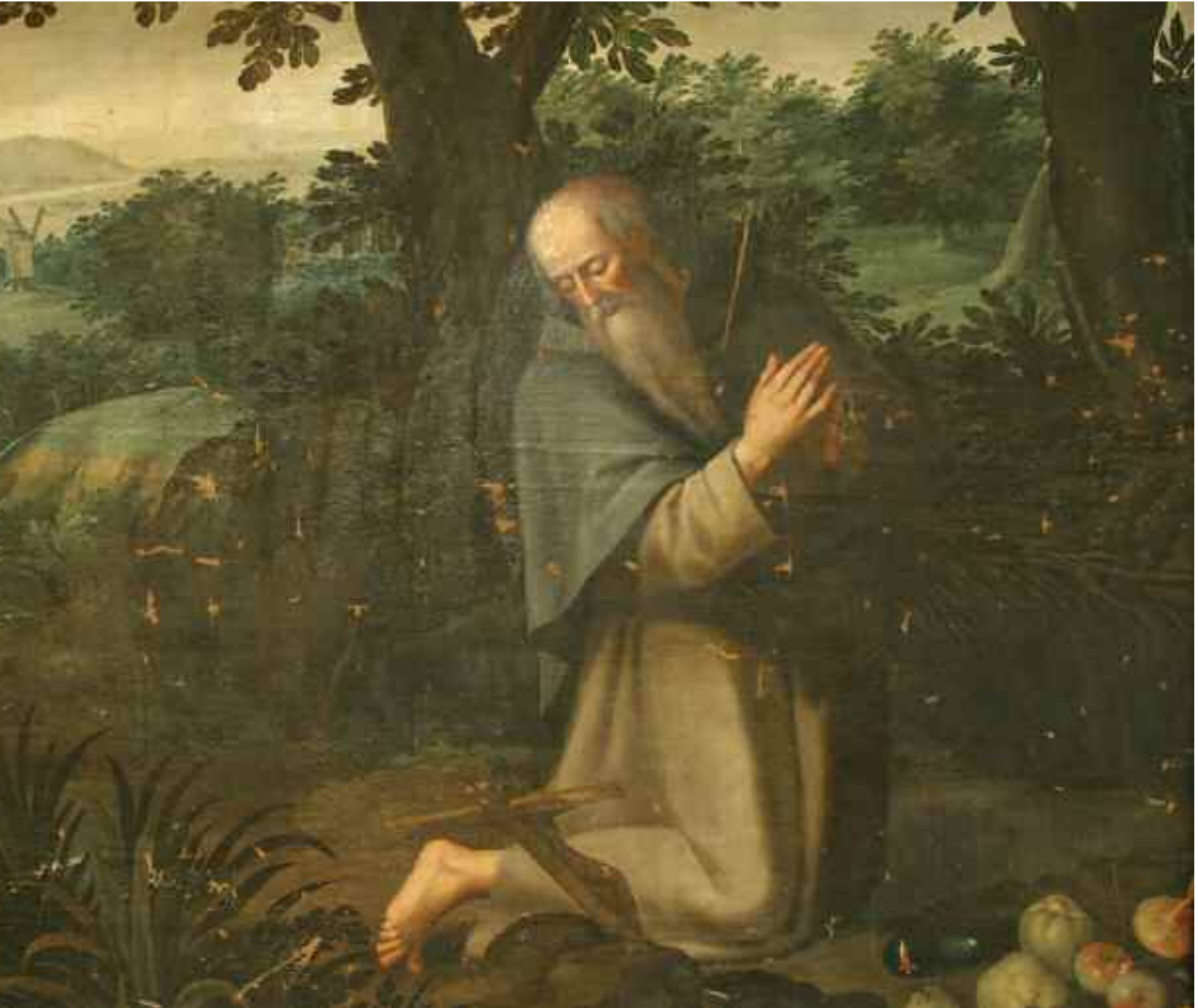
Una de les pintures del convent de Santa María de la Anunciada.