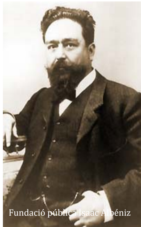
Fundació pública Isaac Albéniz