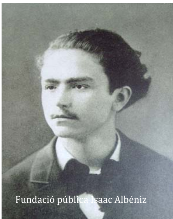
Fundació pública Isaac Albéniz

oferint concerts per diversos països llatinoamericans. La idea d'aquesta gira per America sorgí de diversos amics del seu pare amb la intenció que l'infant prodigi