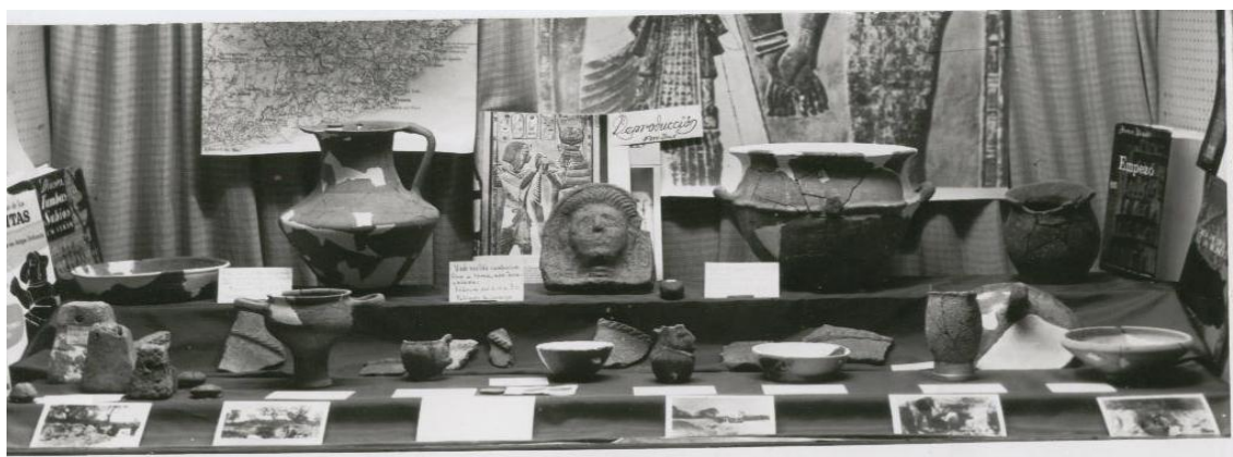
Exposició a l'aparador de Can Llrinós.

18 de novembre de 1966.- Projecten una vitrina per exposar les peces, i aconsellats per Miquel Oliva Prat projecten redactar uns estatuts. Proposta d'exposició de les troballes a l'aparador de Can Llrinós, una petita botiga al centre del poble.