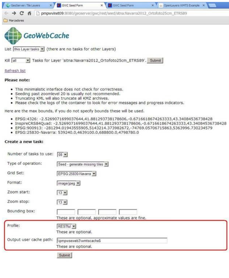
Figura 5: Modificación realizada en GeoWebCache.

Estas modificaciones se han publicado en el sitio del proyecto en github [6].