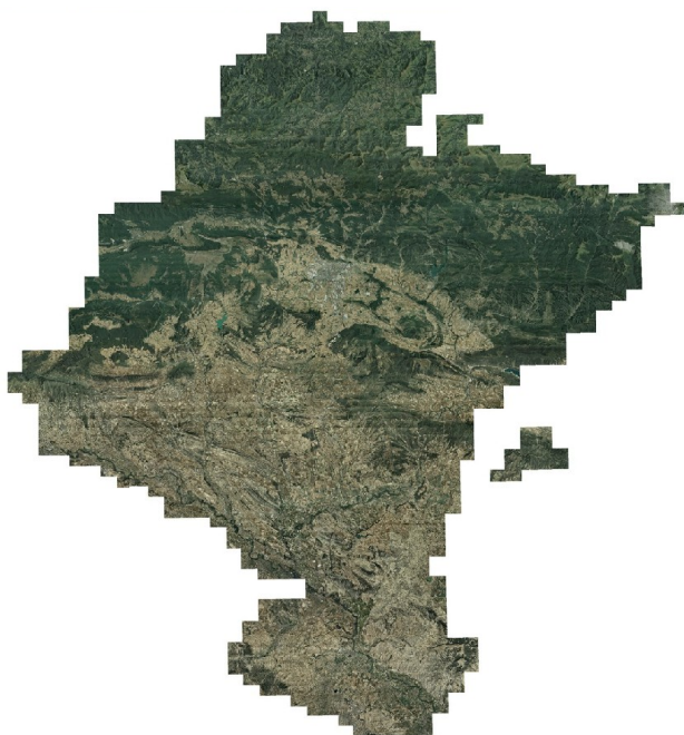
Figura 4: Ortofoto 2012 de Navarra.

Los datos a publicar eran los aproximadamente 10.000 km 2 de superficie de la ortofoto de Navarra 2012, con resolución de 25 cm y proyectada en el sistema de referencia espacial ETRS89 / UTM zona 30N (EPSG: 25830). Se hicieron pruebas de rendimiento con varios formatos: mosaico de varios GeoTIFF, BigTIFF y JPEG2000. Finalmente se adoptó el formato GeoTIFF.