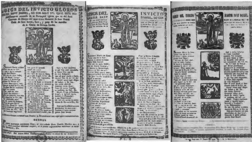
Fig. 1 - Goigs del invicto glorios [sic] mártir Sant Daniel lo cos sant del qual esta honorificament recondit en sa Parroquial Iglesia que es del Real Convent de Monjes del mateix seu Monestir de Sant Daniel Orde de Sant Benet, fora, y prop de las murallas de la Ciutat de Gerona fundat. Gerona: Per Anton Oliva Estamper, y Llibreter al carrer de las Ballesterias. Idem. Gerona: Per Agustí Figaró, y Oliva Estamper y Llibreter en las Ballesterias. - Idem. Gerona: Imprenta de Tomas Carreras, carrer de las Ballesterias. Médiathèque Centrale d'Agglomération E. Zola, Montpellier.

Anton Oliva. Per acabar, podem veure aquesta mateixa estampa en els goigs editats pel fundador de la impremta Carreras l'any 1860, Tomás Carreras.