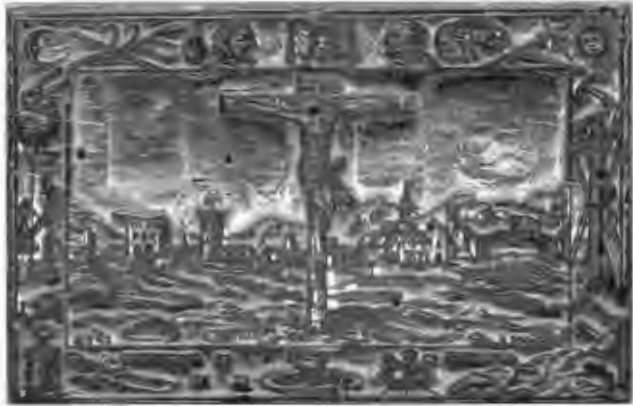
Fig. 4 - Crucifixió amb un paisatge que ens evoca Girona. Xilografia. 1688. Núm. reg.: 135.350 8 x 12,5 x 8,5 cm. Fons impremta Carreras. Museu d'Art de Girona.