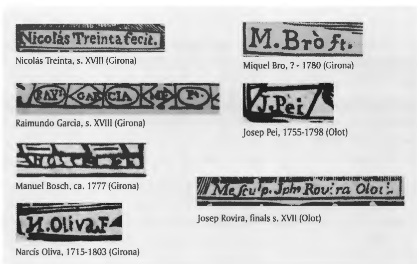
Fig. 7 Signatures dels impressors i gravadors barrocs que s'han pogut identificar dins del fons Carreras del Museu d'Art de Girona.