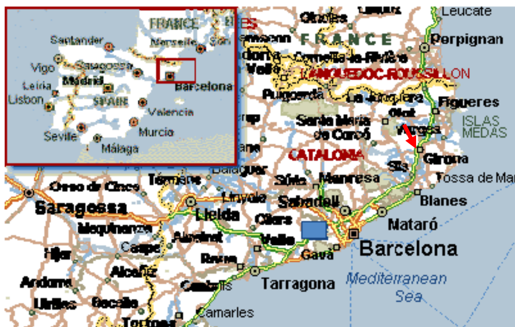
Figura 1. Situació del Golf Girona.

Situació geogràfica : Golf Girona pertany a la península ibèrica, a la Comunitat Autònoma de Catalunya. Es troba situat a la comarca del gironès, al nord-est del terme municipal de Sant Julià de Ramis, i limitat pels municipis de Palol de Revardit a la banda nord, i per Sarrià de Ter al sud. La urbanització i el camp de golf es localitzen al cim d'una muntanya, al costat del castell de Montagut i del Volcà del turó d'en Guilana.