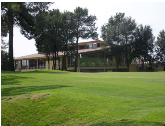
Figura 49. Casa Club

Pel que fa a les característiques de la façana exterior cal remarcar que les parets de la planta baixa són de pedra. Aquesta planta queda sectoritzada de la resta de l'edifici on les parets són remolinades i pintades d'un color pastel.