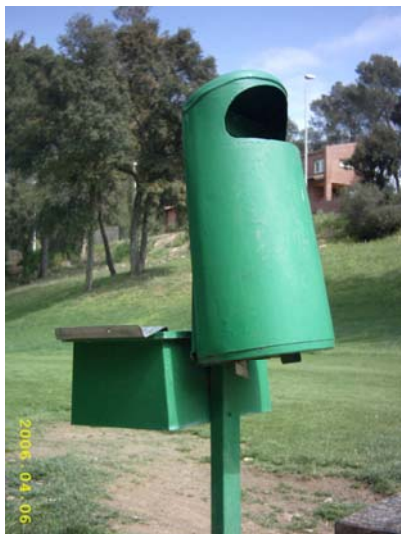
Figura 58. Paperera verda amb caixeta incorporada