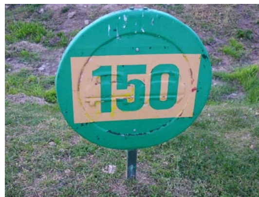
Figura 63. Senyal indicadora de la distància de 150 metres