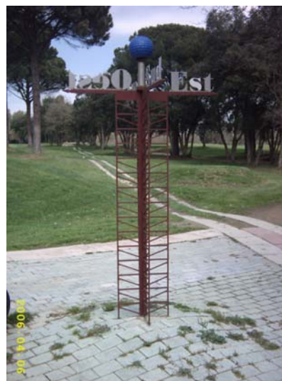
Figura 69. Escultura dels punts cardinals.