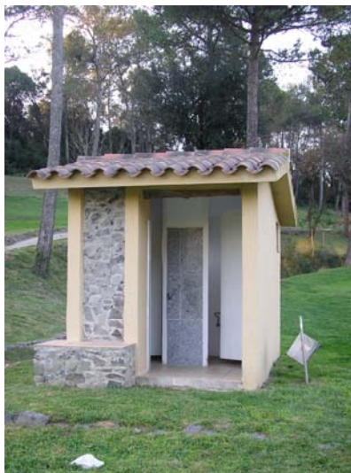
Figura 53. Lavabo del green 3