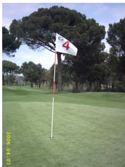
Figura 64. Bandera indicadora del green 4