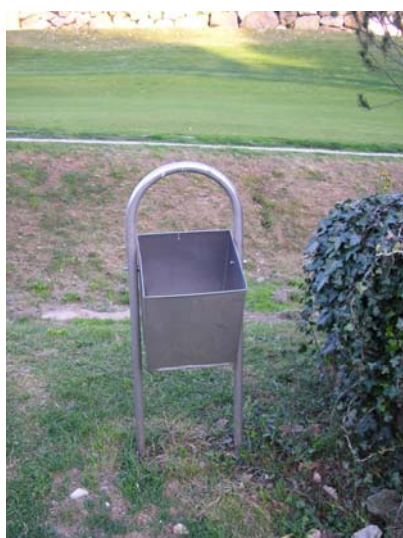
Figura 56. Paperera metàl·lica