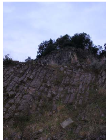
Figura 48. Columnes basàltiques