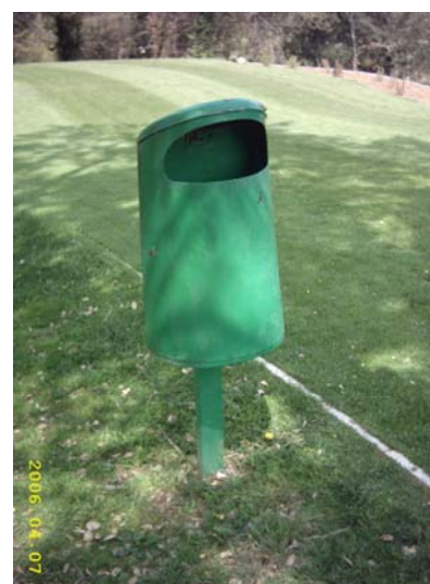
Fotografia 57. Paperera verda