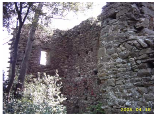
Figura 72. Interior del Castell de Montagut.