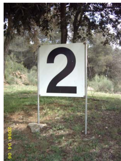
Figura 65. Pannell indicador del carrer 2