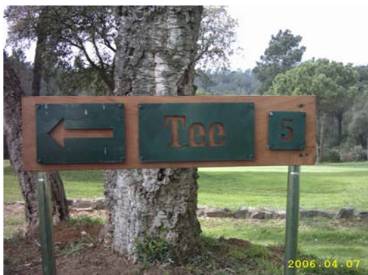
Figura 62. Cartell indicador del tee 5 metres