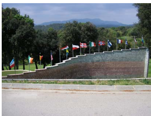
Figura 70. Banderes de diferents països.