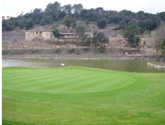
Figura 46. Turó de Can Guilana

Es tracta d'una xemeneia volcànica on els basalts presenten una estructura columnar inclinada molt interessant, producte de l'extrusió obliqua de la lava. Al seu voltant es troben dipòsits piroclàstics originats per l'acumulació de cendra i escòria expulsats per l'erupció, fa uns 30.000 anys. Antigament se n'havia extret el basalt en blocs per a la construcció de les masies properes. Actualment el POUM de Sant Julià de Ramis protegeix aquest espai pel seu interès natural.