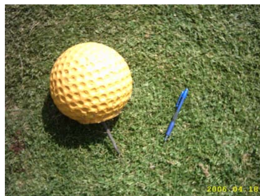
Figura 67. Bola indicadora categoria groga.