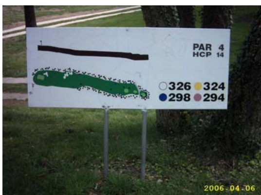
Figura 66. Cartell informatiu