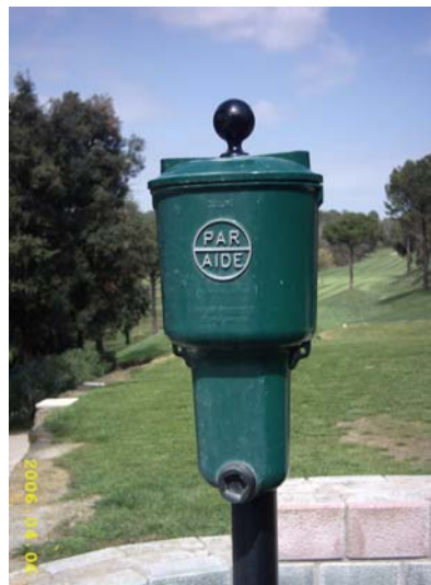
Figura 59. Neteja-boles

La següent taula mostra el mobiliari que tenim a cada tee i green del golf: