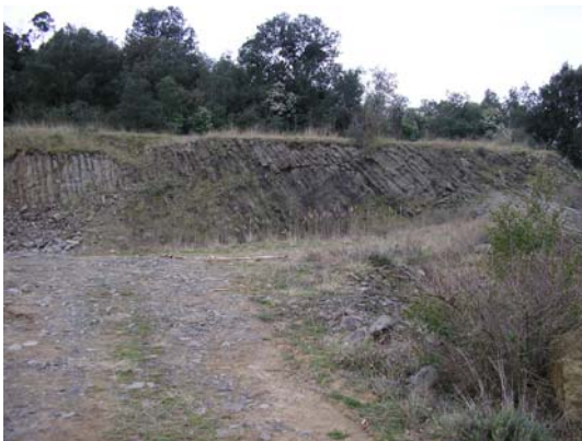
Figura 47. Columnes basàltiques inclinades