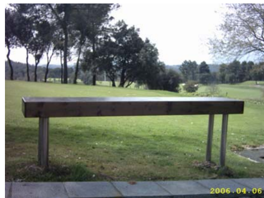
Figura 55. Banc de fusta