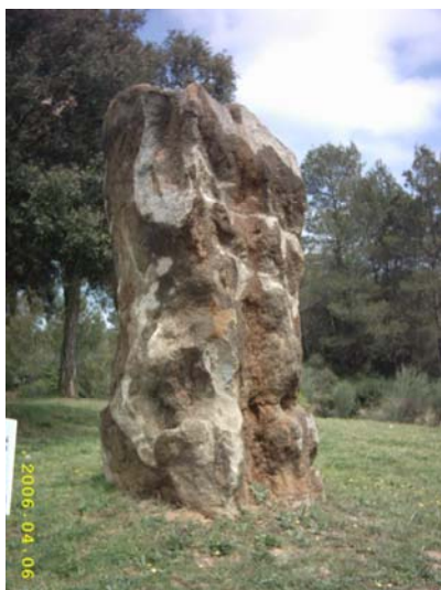
Figura 68. Roca ornamental tee 2.