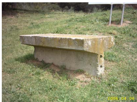
Figura 54. Banc de ciment