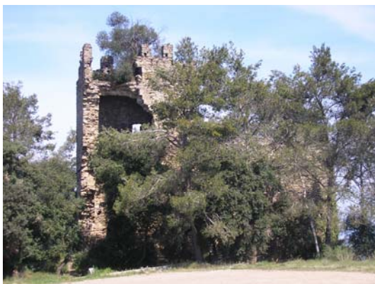
Figura 71. Castell de Montagut.

L'aixecament del castell pot datar-se entre els segles IX-X, amb afegits i reformes posteriors fins al segle XIV. Durant la guerra de la Independència va ser útil com a punt de guaita per vigilar els moviments de les tropes franceses, però des del primer moment del tercer setge (1809) va ser ocupat per les forces invasores. Possiblement la seva destrucció principal va tenir lloc al llarg de les invasions del segle XVIII i durant la guerra de la Independència ja estava arruïnat.