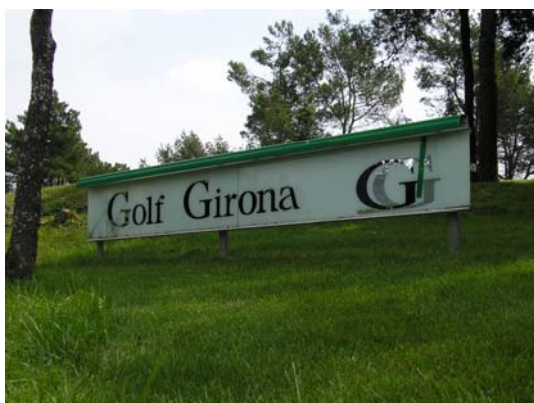
Figura 60. Cartell enunciatiu del Golf