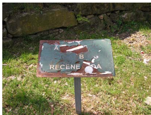
Figura 61. Cartell indicador d'aigua de depuradora