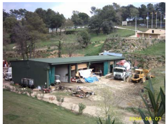
Figura 51. Taller mecànic i magatzem