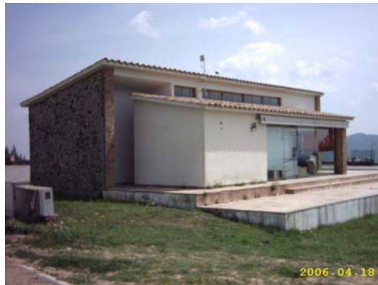
Figura 52. Oficina de les banderes

planta. La façana exterior és de pedra, excepte una banda que és remolinada i pintada de color blanc.