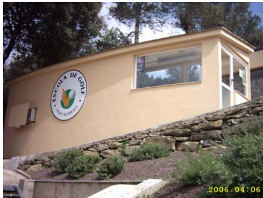
Figura 50. Escola de Golf