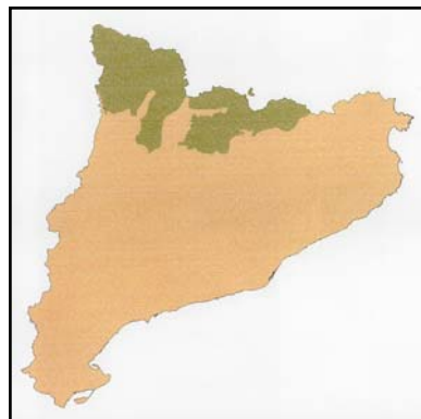
Figura 2 – Regions biogeogràfiques a Catalunya (alpina en color fosc i mediterrània en clar)

El llistat actual d'espais proposats per formar part de la xarxa Natura 2000 es deriva d'una sèrie de propostes successives formulades pel Departament de Medi Ambient i Habitatge en virtut dels procediments establerts al Capítol 3.