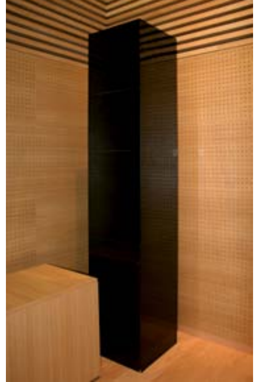
Black Hole II bis (1988). Francesc Torres Monsó.