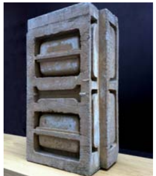
Formigó (1968). Domènec Fita.