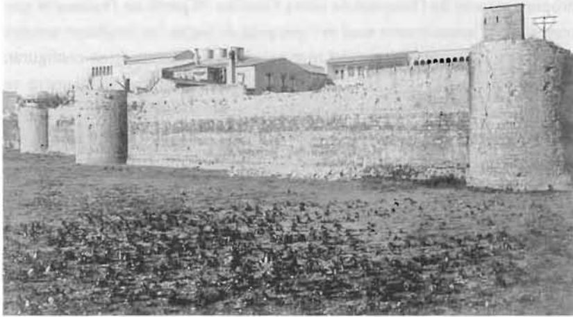
Fotografia antiga de Fagnoli, on encara s'observa un tram de la muralla del Mercadal protegit amb torres. La imatge fou presa des de la banda nord de l'actual plaça Calvet i Rubalcaba.

Gerona: Muralla enderrocada de la ronda del Dr Robert. V. Fagnoli.