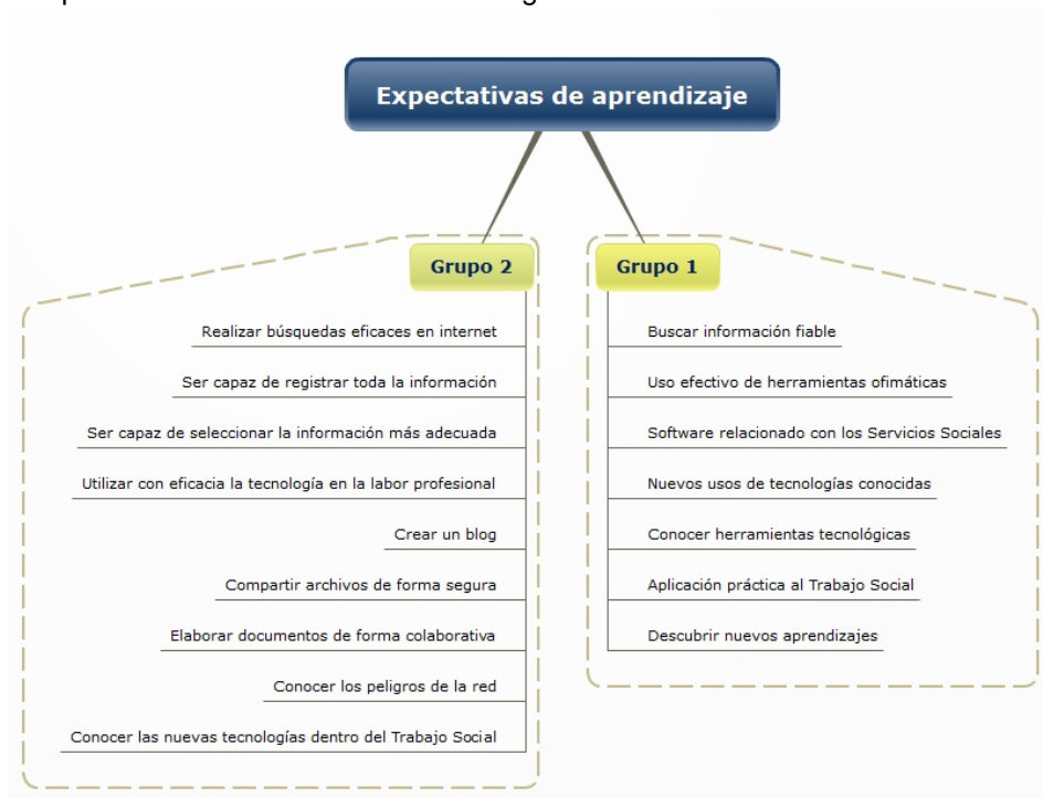
Figura 3. Expectativas del alumnado ante la asignatura.