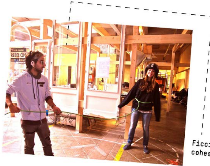
Ficció com a cohesió de grup