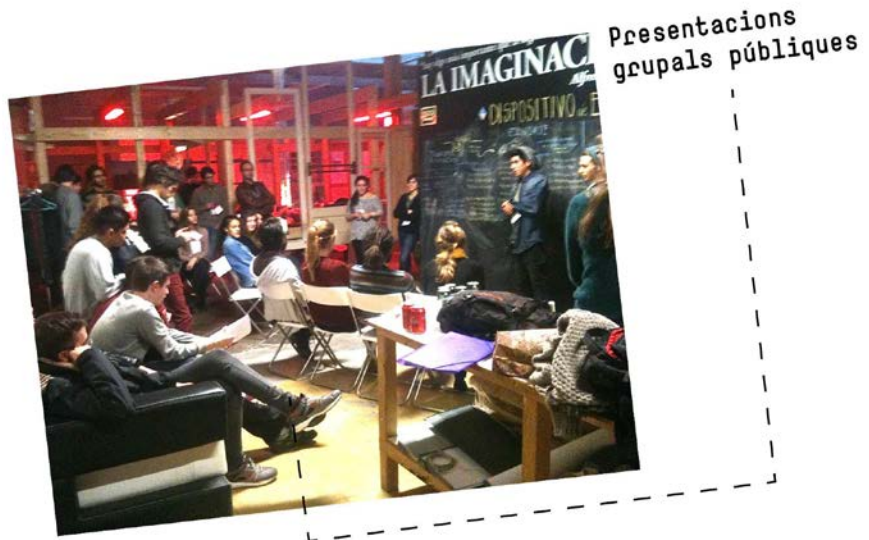
Presentacions grupals públiques