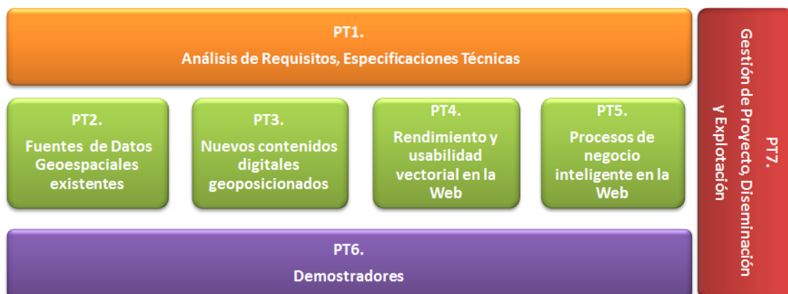
Figura 2: Distribución de los paquetes de trabajo de GEOStore

A estos paquetes de trabajo hay que sumar tres paquetes de trabajo genéricos para los de I+D+i, como son Análisis de Requisitos y Especificaciones Técnicas (PT1), Demostradores (PT6) y la Gestión de Proyecto, Diseminación y Explotación (PT7).