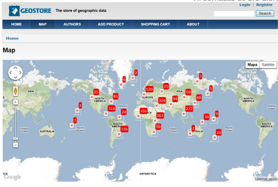
Figura 4: Aspecto de la versión alfa de la tienda online GEOStore.