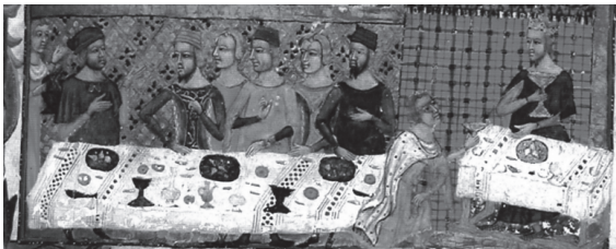
El sopar de Tarragona, novembre de 1228, on es decidí emprendre la conquesta de Mallorca.

noblesa, força canviants en aquests anys d'inestabilitat, són difícils de precisar, però el cert és que, a mesura que Jaume I guanyava experiència, devia anar considerant el comte d'Empúries com un aliat ferm contra l'aristocràcia desafecta. Aquesta aliança culminà amb un ampli pacte entre el rei i el comte l'any 1223. Ambdues parts prometeren ajudar-se mútuament en les guerres contra els seus enemics, «sense importar lligams de sang, senyoria o aliança», i no prendre part de forma separada en Paus o Treves des del Cinca fins a Salses, això és, en tot el Principat sencer. Només Nunyo Sanç, comte del Rosselló i estret aliat d'Hug IV, fou exclòs d'aquest pacte. Com que el comte d'Empúries havia atès el seu territori propi durant la infantesa del rei i havia decidit no aprofitar-se'n a través de les finances o del desafiament obert, ara que el monarca assolía la majoria d'edat el comte en recollia unes recompenses substancials.