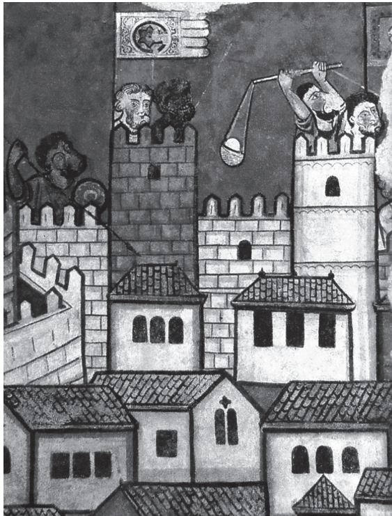
L'assalt final a la ciutat de Mallorca. Les torres de les muralles i l'Almudaina encara estan en poder sarraí (Fresc del palau Aguilar, MNAC, Barcelona).

El comerç marítim creixia a Roses i Cadaqués i en aquest darrer lloc s'hi establí un lucratiu peatge. Com a resultat de tot això, Hug IV havia establert tractats, de forma independent, amb Marsella i Narbona. Aquestes connexions afavoriren que els habitants d'Empúries prenguessin part en l'expedició de Mallorca, i, a més, que molts d'ells colonitzessin l'illa. El comte d'Empúries aportà setanta cavallers a l'expedició, a un exèrcit que en comptava un total de vuit-cents: és a dir, va ser una de les contribucions més grans d'un sol magnat. Les seves proeses durant el setge de Palma ocupen un lloc destacat en les relacions que en feren tant el rei Jaume com el cronista Bernat Desclot, que relaten com el comte i els seus homes tingueren un gran protagonisme a l'hora de debilitar els murs de la ciutat abans de la seva caiguda. L'ocupació de Palma i la submissió de les bosses de resistència en altres llocs de l'illa posaren el punt final al primer gran triomf de Jaume I i complagueren l'impuls expansionista dels barons catalans. El mateix Hug IV se'n mostrà igualment satisfet, però l'any 1230, poc temps després d'aquesta victòria militar, morí víctima d'una malaltia que també afectà altres nobles catalans.