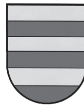
Escut del comte d'Empúries, faixat d'or i de gules.

Durant els primers anys del regnat de Jaume I, caracteritzats per una gran tensió, Hug IV, comte d'Empúries (1200-30), no participà directament en el consell de regència, però fou un ferm partidari del jove rei, a la cort del qual serví ocasionalment. 2 El comte Hug ja era un home madur quan Jaume I inicià el seu regnat: era un reconegut líder militar que exercia la seva autoritat amb fermesa sobre els seus dominis. De jove, havia pogut polir la seva destresa militar en la tercera croada i també havia acompanyat el rei Pere I a la batalla de Las Navas de Tolosa. Aquestes experiències el van preparar per al paper que va jugar posteriorment a l'expedició a Mallorca. Durant aquells primers anys del regnat de Jaume I, tot i la turbulència política que imperava, Hug actuà amb contenció, resistint-se a la temptació de participar en les diverses coalicions de nobles que desafiaven els representants del jove monarca, i preferí consolidar la seva posició dins el seu propi territori.