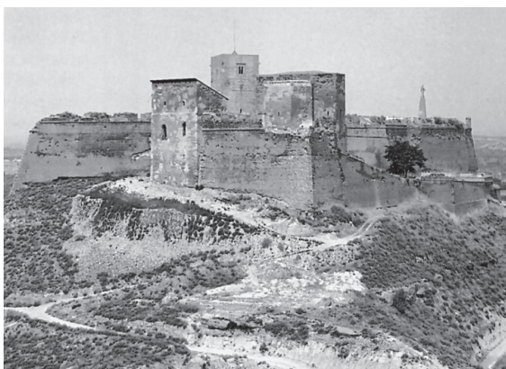
Castell de Montsó, on els monjos templers s'ocuparen de l'educació de l'infant-rei Jaume.

Enmig dels tumultuosos esdeveniments que, a l'inici del segle XIII, van canviar de direcció les relacions entre els comtes-reis i els barons catalans, el comte Hug IV d'Empúries s'erigeix com un personatge de protagonisme destacat. El rei Jaume I havia assumit el tron l'any 1213, quan només era un nen de 5 anys, presoner a mans del seu enemic, Simó de Montfort. 1 Les decisions polítiques desastroses del seu pare, el rei Pere I, havien culminat amb la seva pròpia mort en el camp de batalla de Muret, a Occitània, i havien deixat arruïnades les finances dels seus territoris. Segons els records que el rei Jaume exposà posteriorment a la seva autobiografia, el Llibre dels fets , de nen havia arribat fins i tot a passar gana, de tant com «era la terra destruïda e empenyorada». A causa de la situació desesperada dels seus territoris i de la joventut del rei, el papa Innocenci III intervingué, en primer lloc, per propiciar l'alliberament del nen-rei i, després, per crear un consell de regència, format pels principals magnats, que havia de dirigir els afers d'uns dominis tan inestables com els que havia heretat Jaume I.