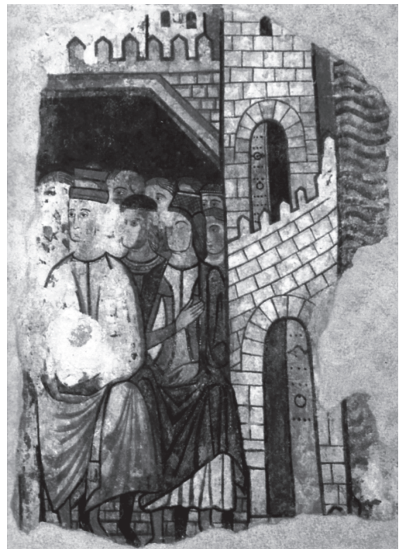
Les Corts de 1228 (Fresc del palau Caldes, MNAC, Barcelona).

Que el pretz que havem perdut, que el cobrem; en esta manera lo cobrarem si vós prenets un regne de sarraïns ab ajuda de nós, que sia dins mar [...] E serà el millor fet que cristians fessen cent anys ha.