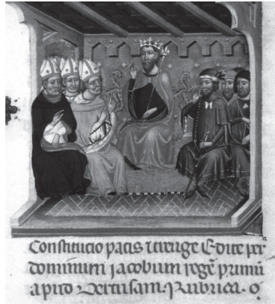
L'assemblea de Pau i Treva de 1225 abans de l'expedició de Peníscola ( Llibre Verd , AHCB, Barcelona).

Quan Jaume I va arribar a la majoria d'edat, a la dècada de 1220, va anar restaurant gradualment les finances dels seus regnes però també s'enredà en les disputes de bàndols baronials. A poc a poc guanyà confiança per manipular les aliances aristocràtiques en benefici propi. L'any 1227 reprimí finalment la rebel·lió de la lliga de magnats aragonesos i també hagué d'apaivagar les revoltes periòdiques de les principals figures del seu consell de regència, incloent-hi Guerau de Cabrera i Guillem de Montcada. Les tensions causades per la noblesa també es feren sentir a Empúries. Els estatuts de la Pau de 1220 contenien una clàusula molt significativa, que es pot relacionar amb una situació de desordre generalitzat: el comte manifestà que ni les amenaces ni les intimidacions no haurien d'impedir a ningú de presentar demandes judicials davant seu. L'any 1222, durant una disputa territorial particularment aspra amb el seu rival perpetu, Hug IV es queixà que el vescomte Rocabertí i els seus seguidors havien trencat la Pau i Treva reial i havien comès una llarga llista d'actes violents i deslleials; i reclamà que el vescomte se sotmetés a la justícia del rei Jaume, sota penyora de mil marcs de plata. Posteriorment, el rei absolgué Hug IV i els seus partidaris, inclòs Hug de Cervià, d'haver trencat la Pau reial a causa de les guerres que el comte havia emprès, en nom del rei, contra els seus enemics. Les diverses aliances amb la