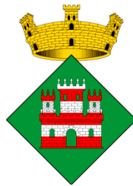
L'escut de Sant Aniol de Finestres

El 922 també es documenta l'antiga església parroquial de Sant Aniol, que anys després el comte Miró II de Besalú va donar a la seu de Girona. L'església originalment era d'estil romànic, però ha patit diverses modificacions i, avui en dia, de romànic, només en conserva l'abscis. També hi ha documentats els terratrèmols del 1427-28, que van originar destrosses en almenys el temple de Sant Aniol.