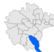
El Municipi a la Garrotxa