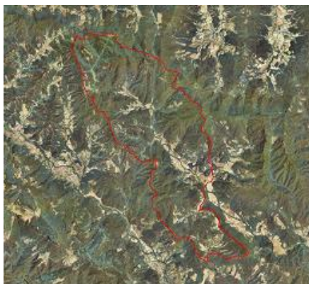
Territori d Sant Aniol de Finestres

El casc antic és el sector històric que dona origen al nucli urbà de Sant Esteve de Llémena.