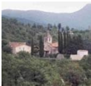
Vista de l'església de Sant Aniol

El 922 també es documenta l'antiga església parroquial de Sant Aniol, que anys després el comte Miró II de Besalú va donar a la seu de Girona. L'església originalment era d'estil romànic, però ha patit diverses modificacions i, avui en dia, de romànic, només en conserva l'abscis. També hi ha documentats els terratrèmols del 1427-28, que van originar destrosses en almenys el temple de Sant Aniol.