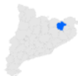
La Garrotxa a Catalunya

Sant Aniol de Finestres és territori muntanyós i està envoltat per diverses serralades, amb muntanyes de més de 1000 m d'altitud. Al sud, resseguint el curs del riu, s'observa la serra que porta el mateix nom del municipi, Finestres, amb el puig de Finestres (1023 m), el turó del Faig Rodó (1018 m) i el Puigsallança (1024