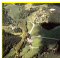
Vista del municipi

El municipi de Sant Aniol de Finestres, situat a 415 m d'altitud a la riba dreta de la riera de Llémèna, pertany a la comarca de la Garrotxa (província de Girona). El seu terme municipal forma part del Parc Natural de la Zona Volcànica de la mateixa comarca i ocupa una extensió de gairebé 48 Km 2 a l'alta vall de la riera de Llémèna. Al nord limita amb Santa Pau i Mieres, a l'est amb Sant Martí de Llémèna (Gironès) i Mieres, al sud amb Amer (la Selva) i a l'oest amb Sant Feliu de Pallerols i Les Planes d'Hostoles. El poble Sant Aniol de Finestres és la capital del municipi, que, a més, està format pels nuclis de La Barroca, Les Carreres, Sant Esteve de Llémèna i les Medes, així com els santuaris o esglésies de Finestres (antic poble i monestir), de Bustins, d'Elena i de Bell-lloc de Llémèna.