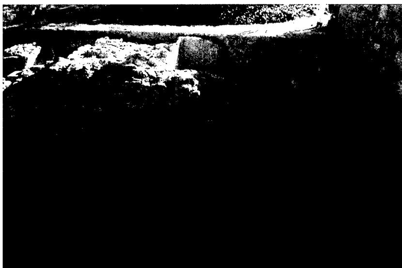
Làm. 4: possibles dipòsits construïts en època tardana a les termes de la uilla de Centcelles.