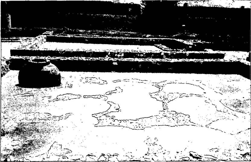
Làm. 1: uilla romana de Torre Llauder (Mataró). En primer pla, l'habitació aprofitada com a magatzem de dolia. En segon pla, l'àmbit on es construeixen dos dipòsits, i a l'esquerra, al fons, el dipòsit construït al peristil (fotografia d'A. Ch. 1996).