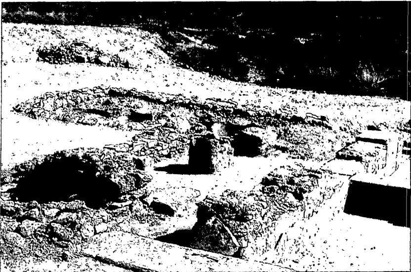
Làm. 2: jaciment dels Munts (Altafulla). Instal·lació industrial (de la qual es conserven vestigis d'una premsa i fons de dolia) situada al costat d'àmbits de caràcter residencial.