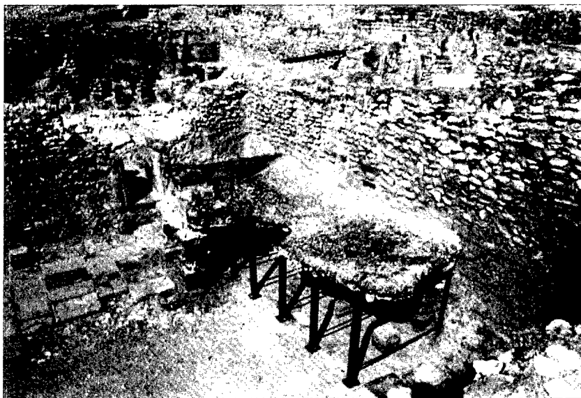
Làm. 3: dipòsit construït en un dels àmbits del conjunt termal dels Munts. El suport de ferro fou construït per M. Berges per preservar-ne l'estructura.