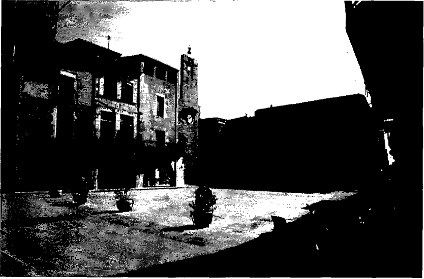
Figura 3. La plaça de la vila.