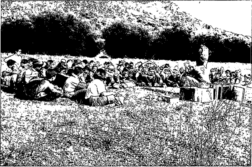
Figura 1. Talla de pedra.