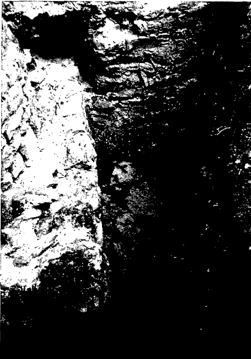
2. Mur est de l'edifici tardoantic a l'exterior de l'església.