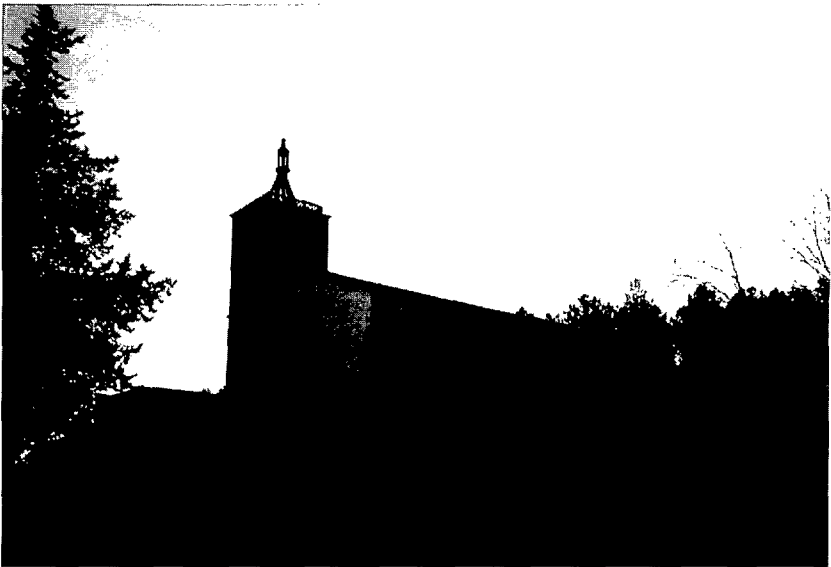
Fig. 1. Església de Montfullà.