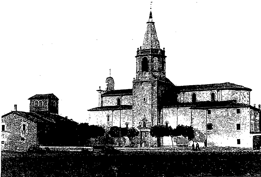
Fig. 3. Església de Salt.