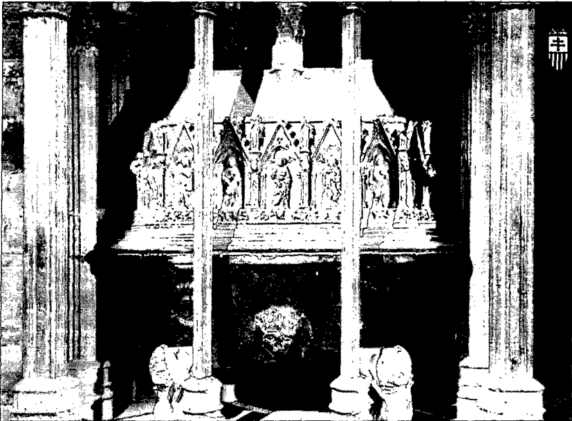
Foto 1. Alveus romà de pòrfid reutilitzat en el sepulcre de Pere el Gran. Monestir de Santes Creus (Tarragona).

el debat científic obert per tal de comprendre la funció del mausoleu de Centelles i la identificació del rang del personatge que hi fou enterrat, s'ha de descartar definitivament la possibilitat de que l'alveus de pòrfid, conservat des de finals del segle XIII a Santes Creus, procedís de Centelles. No disposem de cap element ni de cap indici a favor de la utilització de pòrfid a Centelles; per tant, no es pot utilitzar aquest argument en defensa de la hipòtesi que vol veure en el citat edifici un mausoleu imperial.