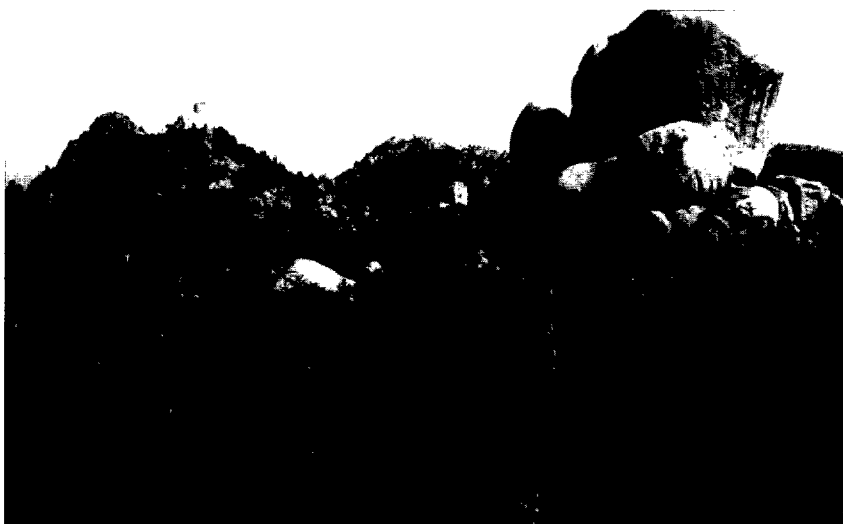
Fig. 2. El castell de Farners amb l'ermita al replà inferior. A l'esquerra, el turó del Vent.