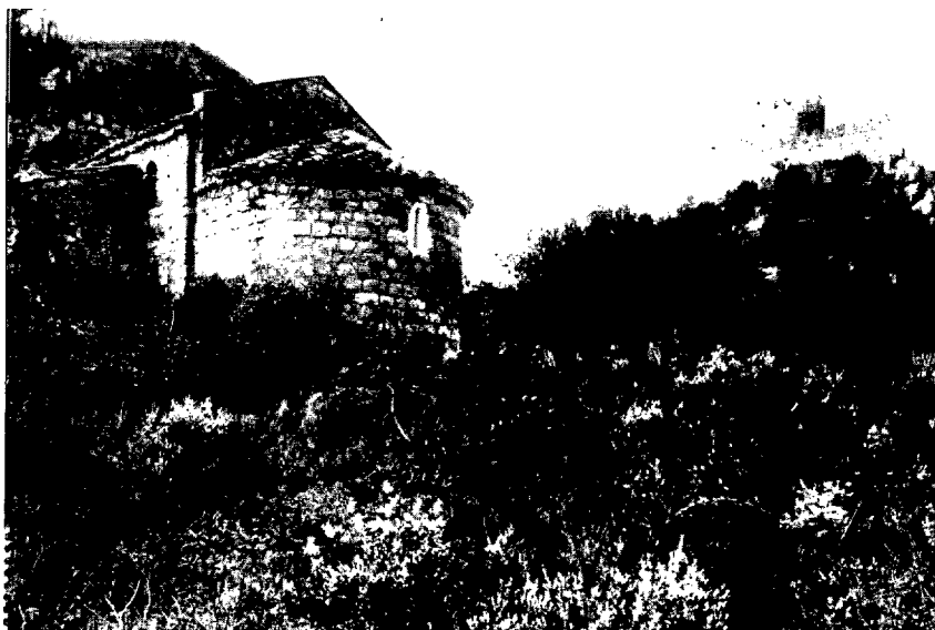
Fig. 1. "De novo constructa ad pedem castris de Farnerio". L'ermita i el castell de Farners, any 1919.