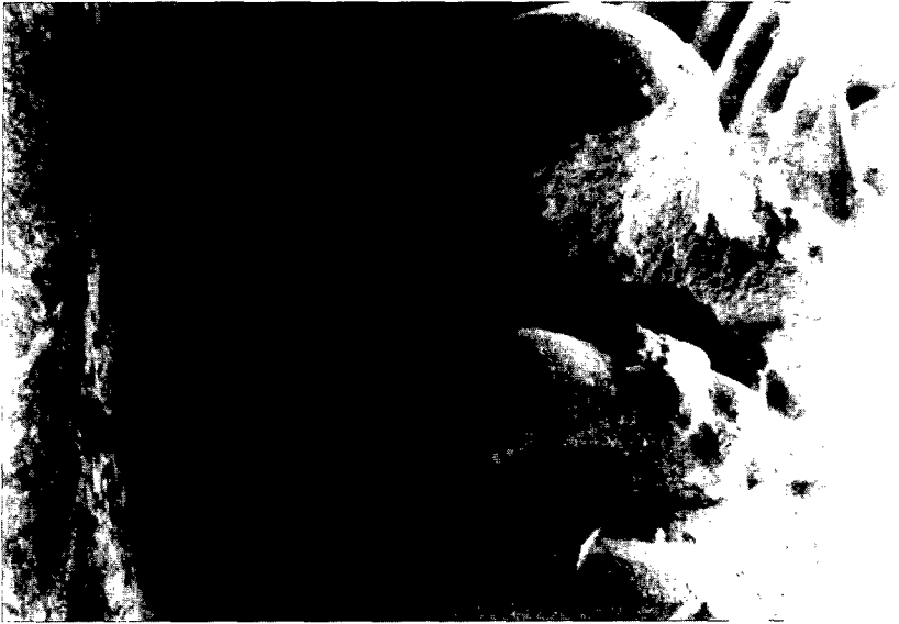
Fig. 8: Leones antropófagos. Claustro del monasterio de Sant Cugat del Vallès: capitel n° 24, galería S.