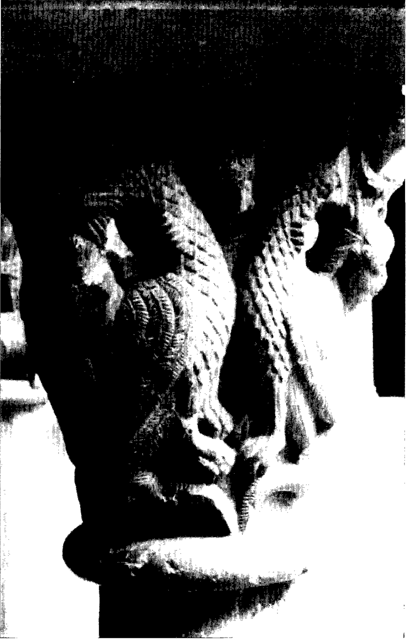
Fig. 1: Hombres y dragones. Claustro de la Seu de Girona: capitel nº 16, galería S.