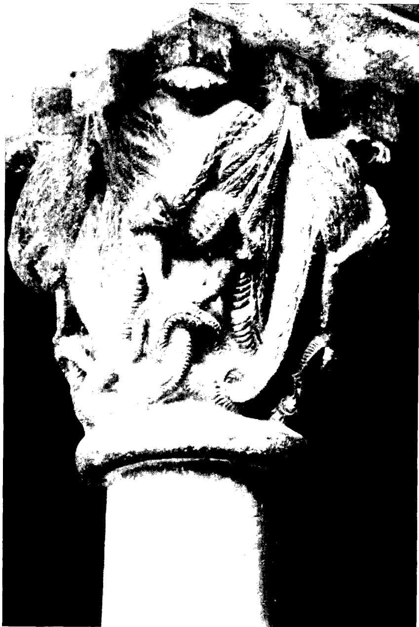
Fig. 6: Dragones. Claustro del monasterio de Sant Cugat del Vallès: capitel nº 123, galería E.