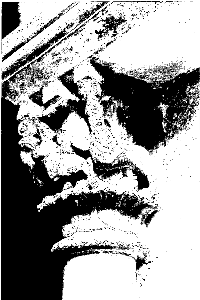
Fig. 5: Lucha de hombres y leones. Claustro del monasterio de Sant Cugat del Vallès: capitel nº 71, galería W.