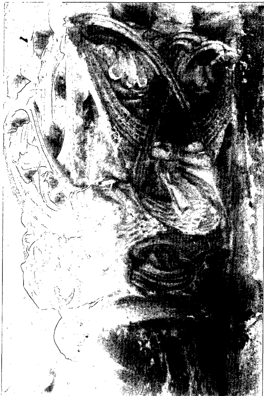
Fig. 7: Hombres cabalgando dragones. Claustro del monasterio de Sant Cugat del Vallès: capitel nº 13, galería S.