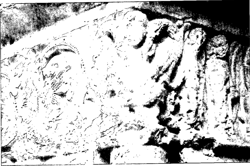
Fig. 2: Hombre entre dragones. Claustro de la Seu de Girona: capitel h. del pilar meridional, galería S.