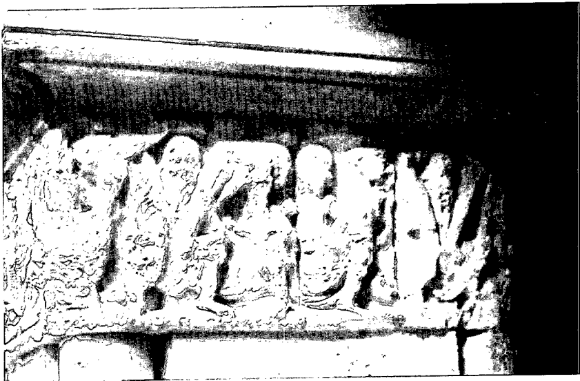
Fig. 3: Hombres y dragones. Claustro de la Seu de Girona: pilar septentrional (VII), galería N.