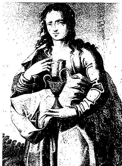
Pintures de Perris de la Roca pertanyents al retaule de la Mare de Déu del Roser, Sant Joan Baptista i Sant Joan Evangelista, de l'ex-col·legiata de Sant Feliu de Girona. (Fotos de l'autor).