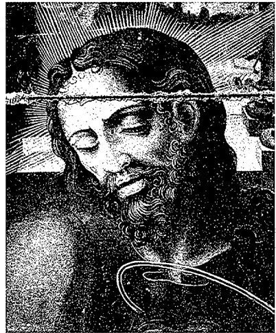
Pintures de Perris de la Roca corresponents al retaule del Corpus, de la catedral de Girona. (Fotos Arxiu Mas).