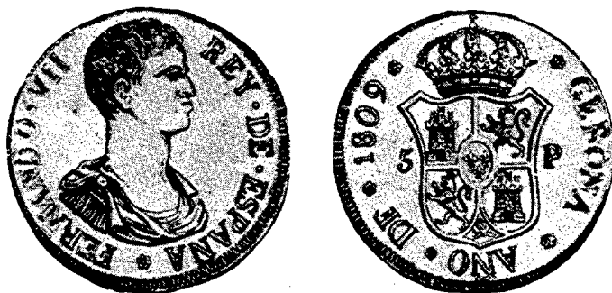
Duro de Gerona del año 1809. — (De HERRERA, lám. I, núm. 9 y BOTET Y SISÓ, pág. 225).