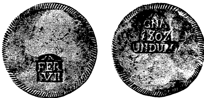
Duro de Gerona, del punzón de 1808. — (De HERRERA, lám. I, núm. 9)