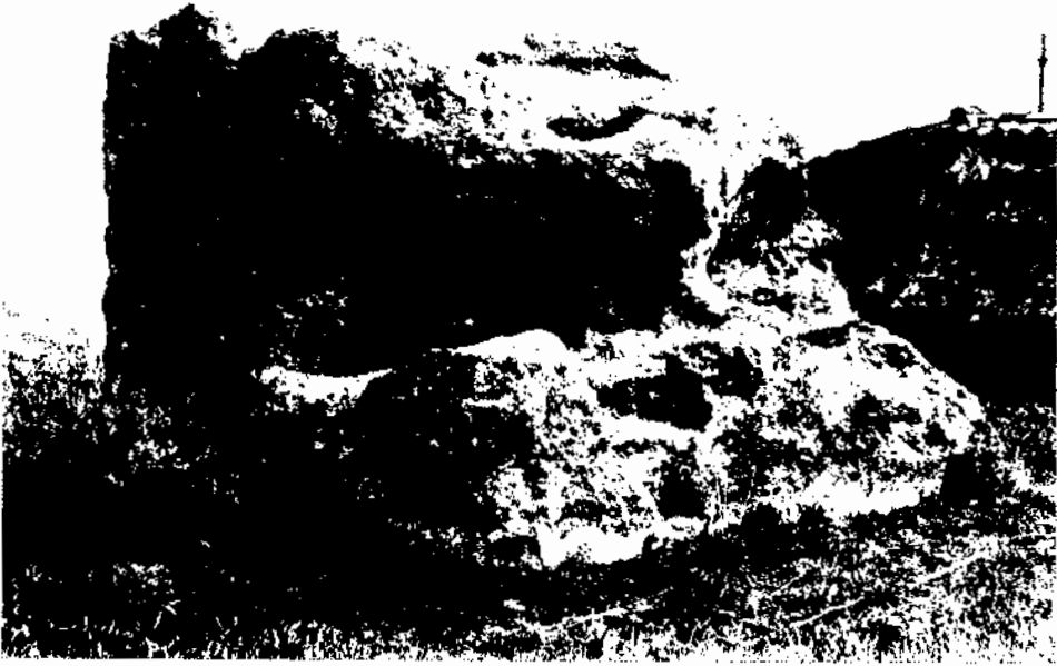
Figura 2. Cal Temple. Vista general del monument des del sud-oest.

passar, també, amb la Torratxa, Riuró i Cufí van localitzar l'any 1947, a l'entorn del monument funerari, evidències fermes d'un forn romà de terrissa (Riuró, 1995, 94 i 99), un model que es va repetint manta vegada i que ens informa millor que cap altra cosa, de les característiques del fundus d'un gran senyor, que cerca l'autarquia a tot nivell i on és grat i adequat enterrar-se.