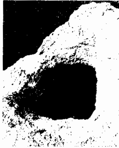
Figura 3. Cal Temple. Detall del loculus de l'urna cinerària.

passar, també, amb la Torratxa, Riuró i Cufí van localitzar l'any 1947, a l'entorn del monument funerari, evidències fermes d'un forn romà de terrissa (Riuró, 1995, 94 i 99), un model que es va repetint manta vegada i que ens informa millor que cap altra cosa, de les característiques del fundus d'un gran senyor, que cerca l'autarquia a tot nivell i on és grat i adequat enterrar-se.