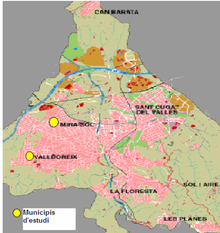
Mapa 1: Mapa de Sant Cugat del Vallès amb ubicació dels municipis d'estudi