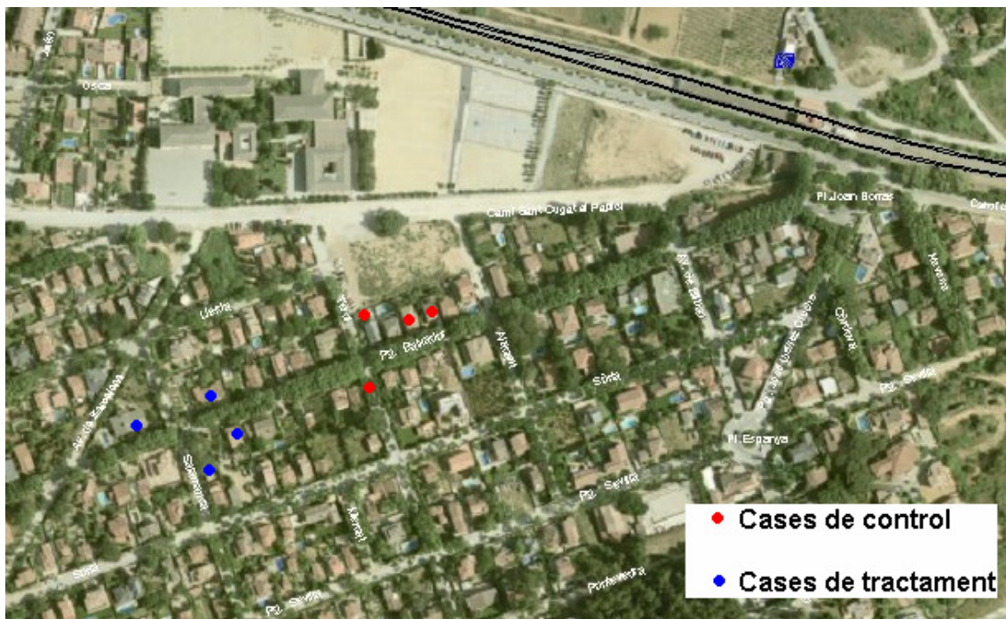
Mapa 2. Ubicació de les cases d'estudi a Mirasol