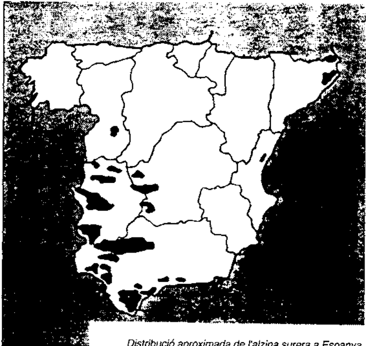
Distribució aproximada de l'alzina surera a Espanya.