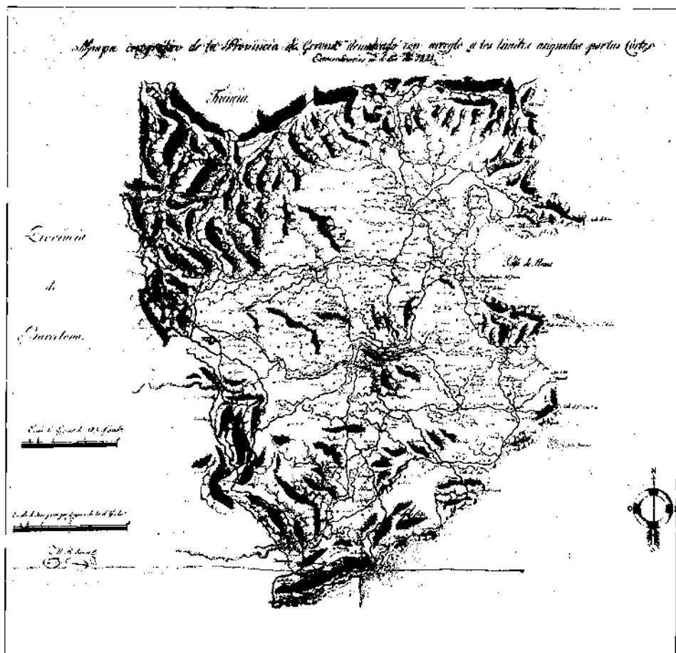
MAPA I. Mapa manuscrit de la província de Girona establerta el 1822, signat per M.R. Garcia, que es conserva al Servicio Histórico del Ejército (Ms. 2467; 001/503). Aquest és l'únic mapa que coneixem on es representa aïlladament una província de la divisió del Trienni.