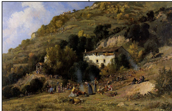
Pintura paisatgística de Josep Berga

Al segle XIX la pintura de paisatge comença a adquirir més importància; aquesta puixança coincideix amb el període de la Restauració borbònica. Ens trobem en un període de prosperitat econòmica, en el qual la burgesia és el motor de la Renaixença cultural del catalanisme polític. La burgesia adquirirà un paper molt important en l'art, ja que aquesta buscarà un art realista, però alhora amable, elegant i optimista. Això donarà lloc a Catalunya a l'inici i la consolidació de diverses escoles pictòriques com ara la d'Olot.