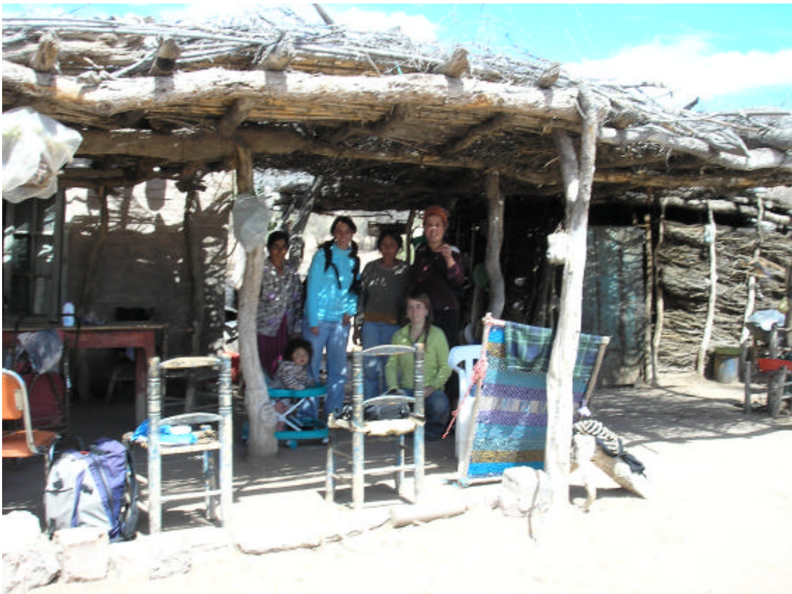
Imagen 1: Puesto de “Las Hormigas”, Comunidad Huarpe de Huanacache.

Surge a partir de la propuesta de la Universidad Nacional de Cuyo de participar en el proyecto “Ordenamiento del territorio, turismo y educación desde el paradigma del desarrollo sostenible”.