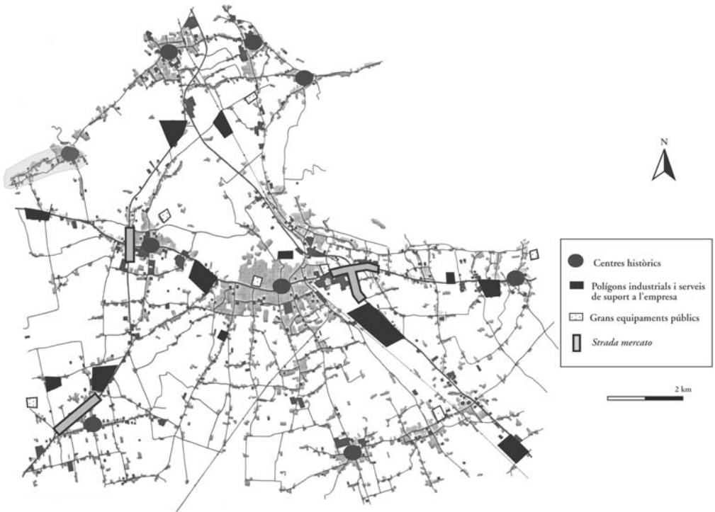
Mapa 3. Lectura sintètica del territori.