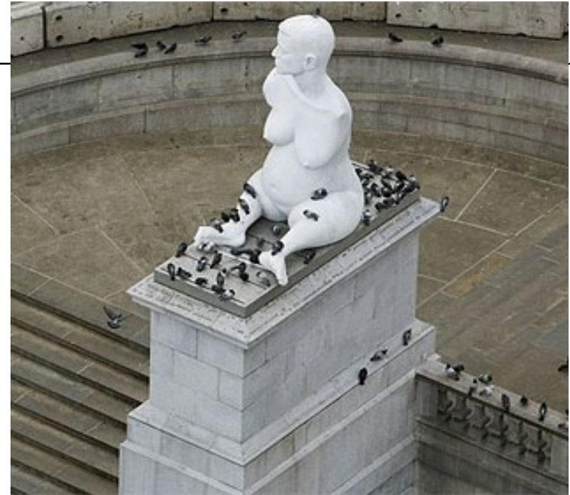
"Alison Lapper embarazada" Trafalga Square (Londres)