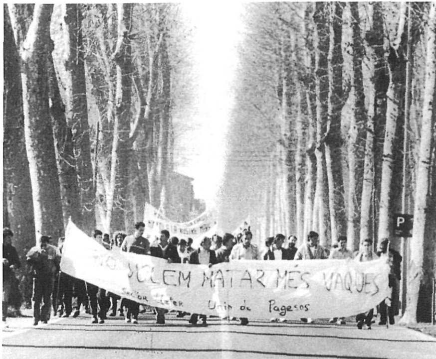
Manifestació per la problemàtica del sector lleter, a la Devesa de Girona, el 9 de febrer de 1988.

definitiva, cal buscar els mecanismes necessaris perquè no plegui cap més pagès i perquè els empresaris agraris d'avui tinguin els arguments necessaris per desenvolupar la seva activitat agrària dins els paràmetres de diversitat i benestar.