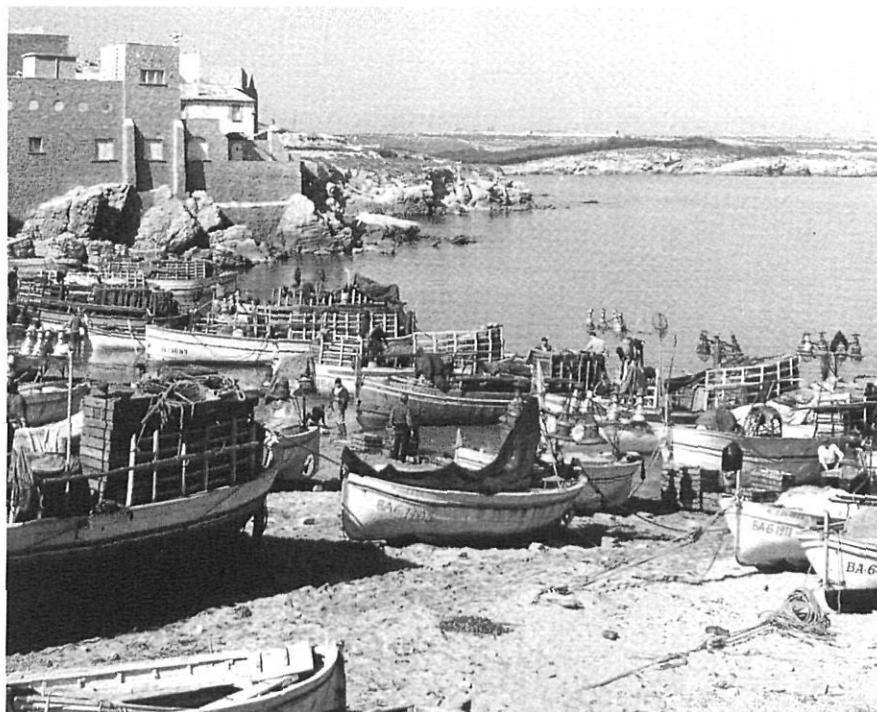
La platja de l'Escaló amb Empúries al fons, l'any 1957.

palangre, les nanses i els tresmall—, que excepte el bou venien d'una llarga tradició, van donar pas a sistemes de pesca innovadors, els quals, basats en els mateixos principis, provocaren tot un seguit de canvis que esdevingueren irreversibles.