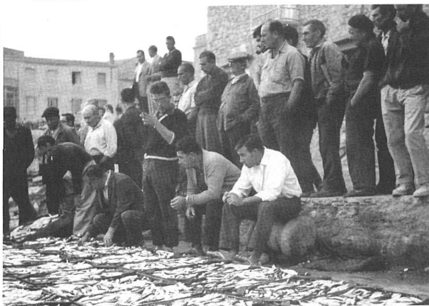
Subhasta de sardines a la Riba Vella de L'Escala, l'any 1957.

introducció de materials nous i el volum d'ormeigs calats són les diferències més destacables respecte als mateixos instruments de fa cent anys.