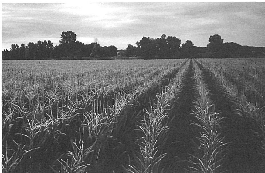
Camp de blat de moro a l'Empordà.

molt especialitzat, i les bones perspectives de futur que ofería, per un costat s'assegurà la transformació industrial d'una bona part de la fruita que per diverses raons no pot anar al mercat (malmesa per la climatologia, deformada o petita ) a través de Co-frugi , una planta transformadora de suc de fruita concentrats; i per l'altre es creà un centre d'experimentació a Mas Badia (la Tallada d'Empordà), on especialistes en diversos camps, amb contacte constant amb les principals zones productores del món, estudien i proposen noves tècniques per millorar rendibilitats i adequar-se a les sensibilitats del mercat globalitzat.