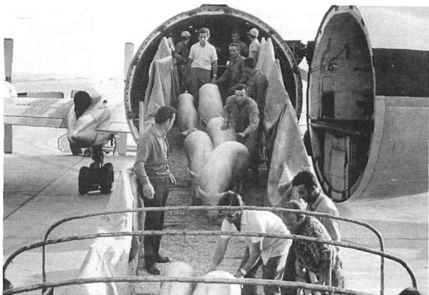
Importació oficial de porcí en vol xàrter a l'aeroport Girona-Costa Brava, l'any 1970.

El procés real de modernització de l'agricultura gironina que es generalitzà a principi dels anys seixanta va suposar una remodelació en la composició i el joc dels factors de producció, i el final del model agrari tradicional lligat a l'autoconsum. Tot plegat representà la posada en marxa del desenvolupament d'un conjunt d'activitats agroeconòmiques noves,