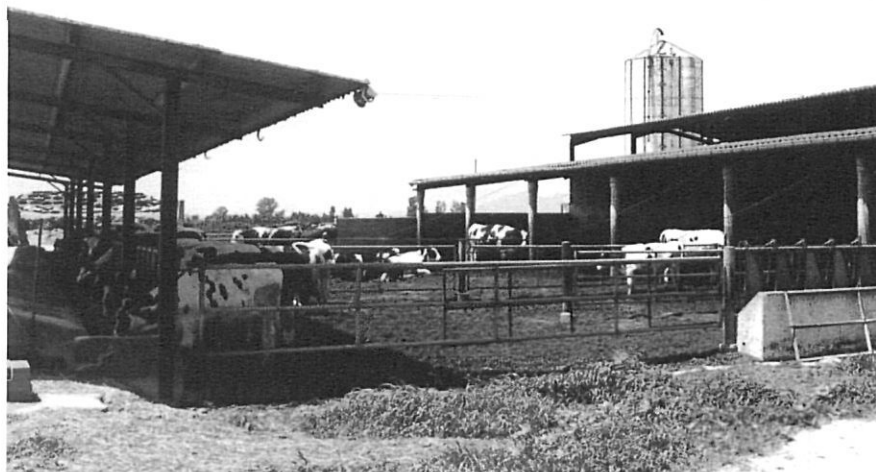
Instal·lacions d'una explotació agrària.

La segona crisi estigué motivada per la competència comercial dels cereals ultramarins en un dels primers episodis del que avui coneixem com a globalització de l'economia. Mai més tornà a haver-hi a Girona tanta superfície conreada o tanta densitat de població rural com en el període 1860-1880. Malgrat les mesures aranzelàries adoptades durant la dècada de 1890, ambdues crisis varen posar sobre la taula el problema de la sobreproducció i la necessitat de trobar