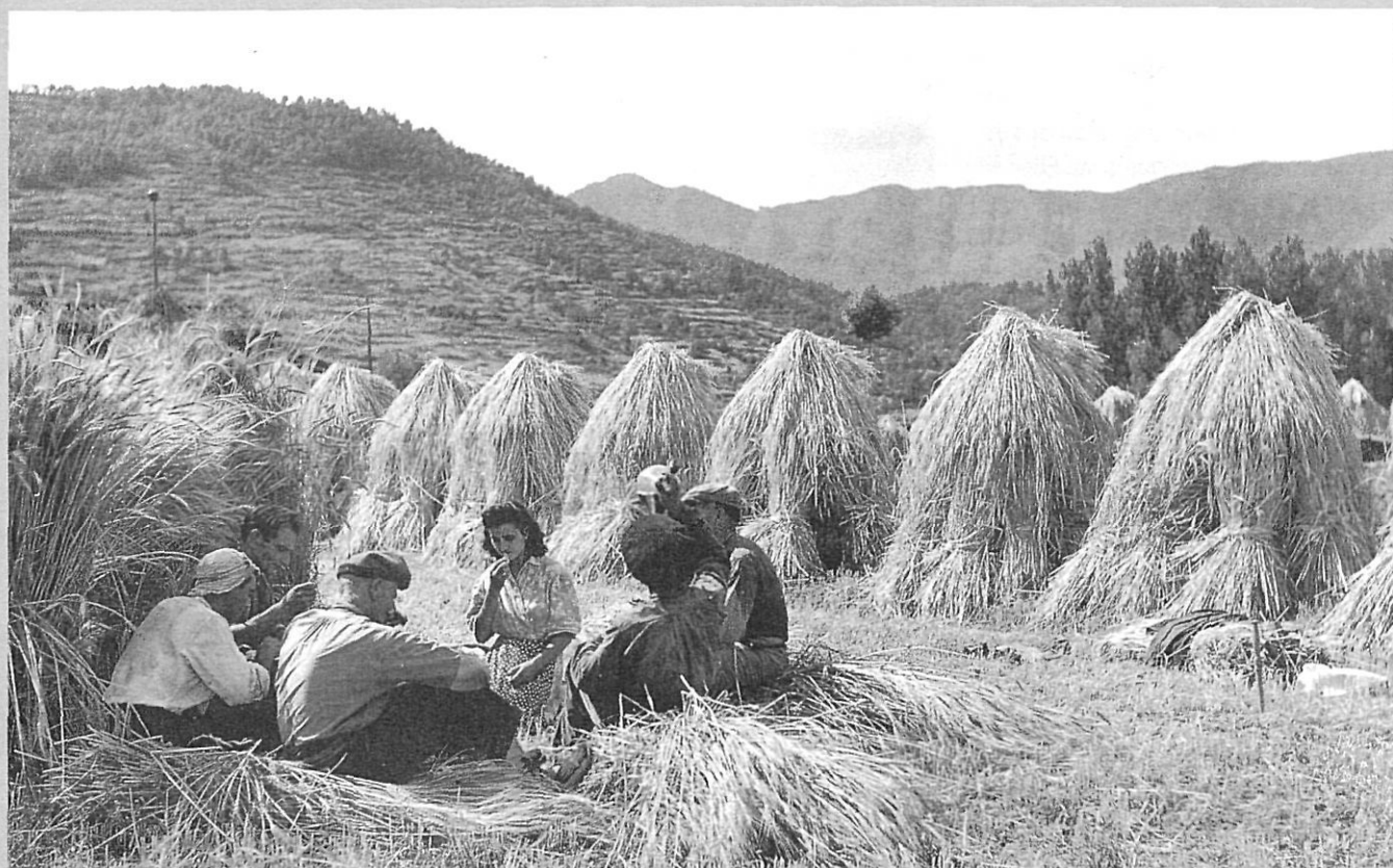
La sega al pla de la Moixina, d'Olot, l'any 1948.