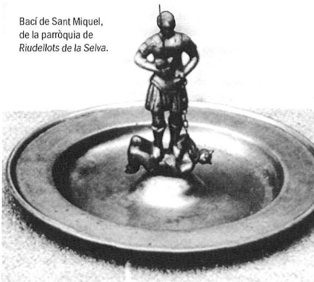
Bací de Sant Miquel, de la parròquia de Riudellots de la Selva.