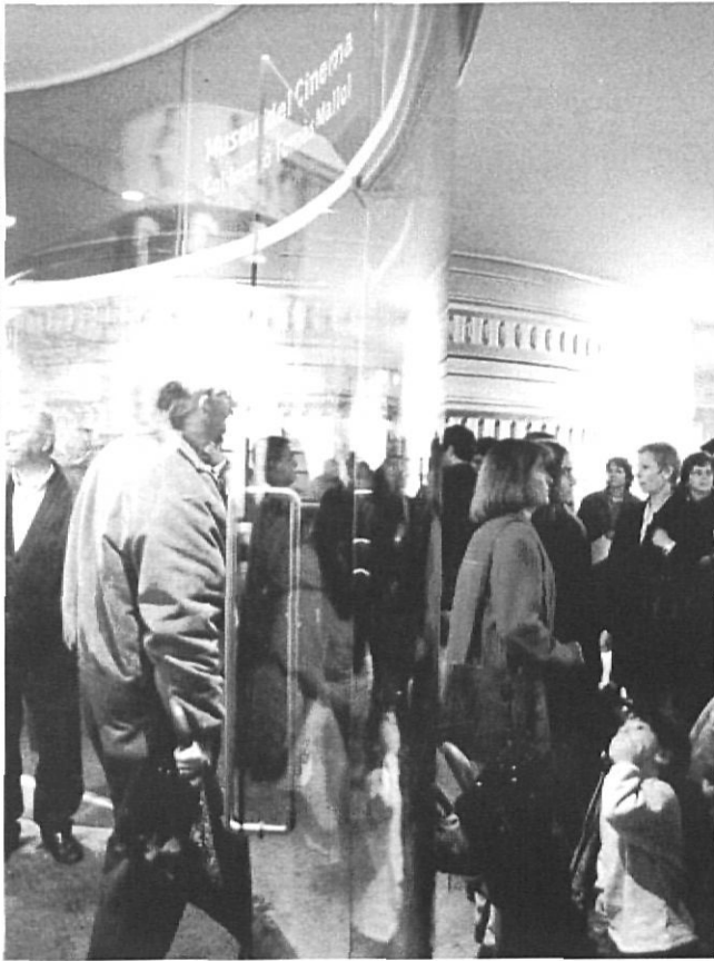
El Museu del Cinema de Girona, el dia de la seva inauguració.