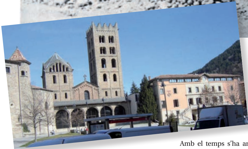
>> El monestir de Ripoll, abans i després de la seva restauració.

que fuera absolutamente indispensable y dejando siempre reconocibles las adiciones». També d'aquella època va ser la revalorització de l'entorn paisatgístic dels monuments, que comportava no aïllar-los, descontextualitzar-los o deslocalitzar-los de l'ambient que els era propi. Però, com passa sovint, les aportacions dels anys vint i trenta del segle passat va costar que penetressin en profunditat en el teixit social i que fossin incorporades pels professionals que més endavant han tingut responsabilitats en el patrimoni. La instauració del règim franquista també va significar un clar retrocés en aquest camp. Si no fos així ¿com es pot entendre, per exemple, que a mitjan segle xx es restaurés la vila vella de Pals amb uns criteris escenogràfics més propis del segle XIX?