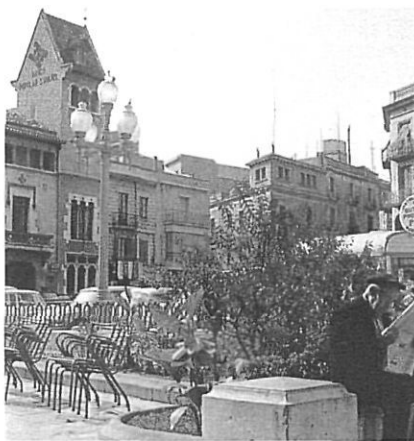
Figueres, centre de serveis d'una extensa plana rural.

Els diversos nivells d'organització del territori (regional, comarcal i rodal) prenen i tenen una incidència desigual en el territori; es formen, doncs, diversos models d'estructura territorial que responen a lògiques diferents, per bé que complementàries. Així, cada model (concentració, dispersió i difusió) privilegia un determinat nivell i margina els altres, de manera que la unitat que és vàlida per a un determinat espai resulta ineficaç per a un territori veí. Per aquest motiu, qualsevol divisió administrativa haurà de contemplar la dimensió polièdrica del territori i la coexistència d'unitats de significació diversa.