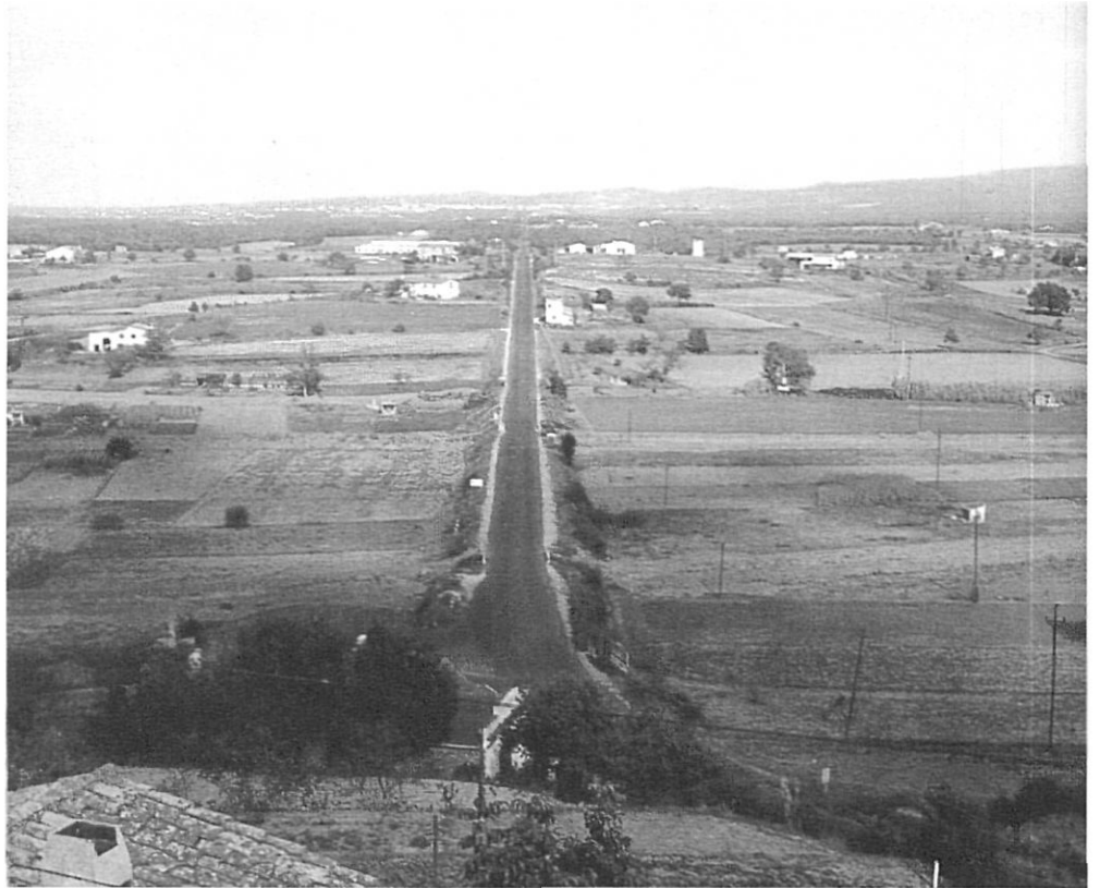
Un paisatge característic de la Regió II: la carretera de Girona a Sant Feliu de Guíxols per Cassà de la Selva i Llagostera.