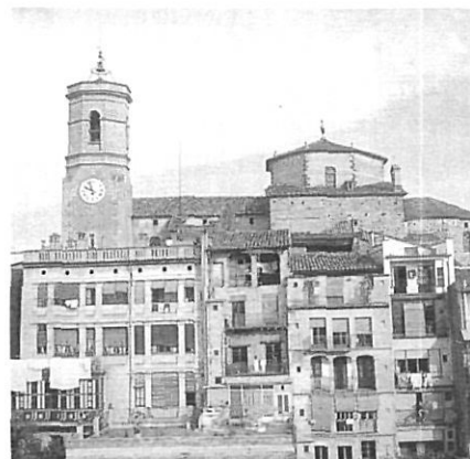
L'aïllament del conjunt de la Garrotxa ha consolidat la centralitat d'Olot.

litorals baixempordaneses i selvatanes i les respectives capitals comarcals, la Bisbal i Santa Coloma de Farners, en són un bon testimoni.