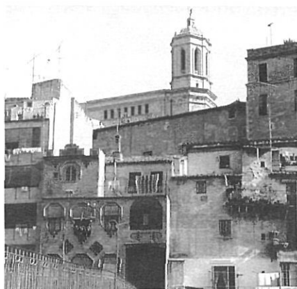
En la capitalitat de Girona hi conflueixen diversos nivells de jerarquia.