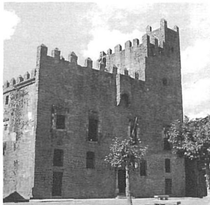
La Bisbal, entre la capacitat d'atracció de Girona i el dinamisme del litoral.