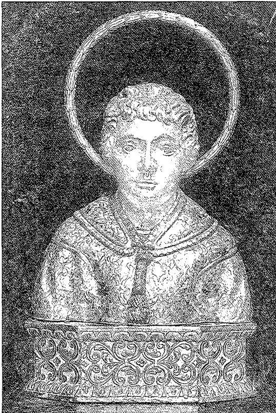
Figura 3. Reliquiari d'argent representant el cap del màrtir Feliu. Deaparegut el 1936.

8. La resurrecció de Llätzer. Jesucrist, que sosté el volum amb la mà esquerra i la vara taumatúrgica amb la mà dreta, té la mirada posada a la seva esquerra, on hi ha el sepulcre buit de Llätzer –representat per una construcció columnada i coronada per un frontó, al costat de la qual, agenollada, s'hi troba la germana de Llätzer.