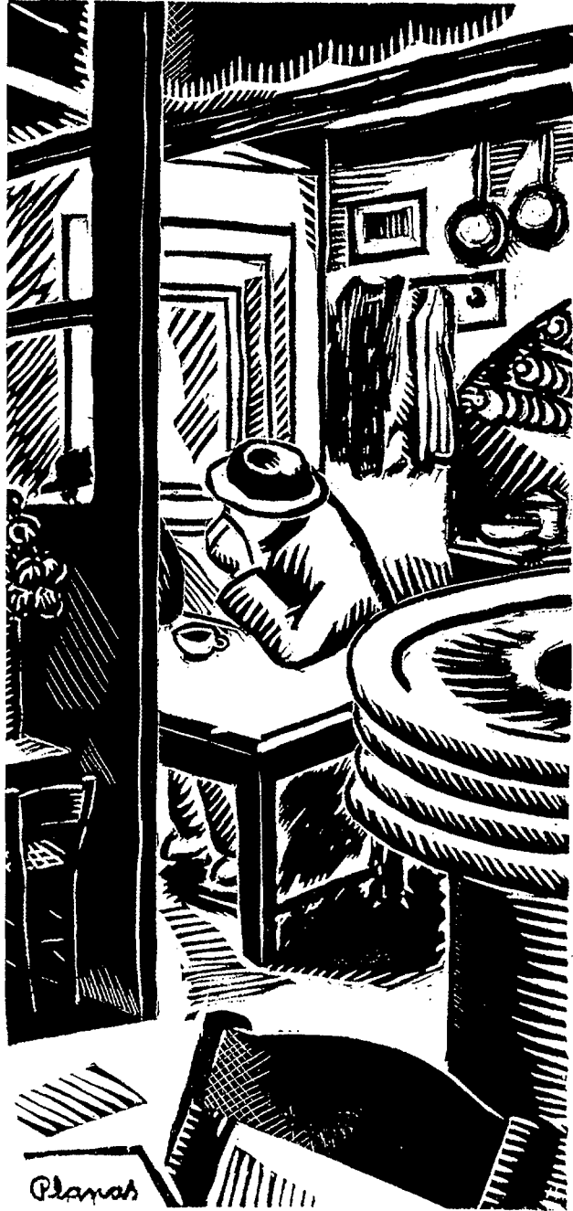
Gravats de Pau Planas, publicats a L'Espurna , portaveu del POUM.