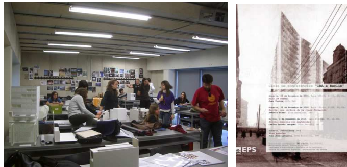
Figura 2. Actividades de grupo en el aula, curso 2009-2010 y cartel del ciclo de conferencias “IBA a Berlín”, curso 2010-2011