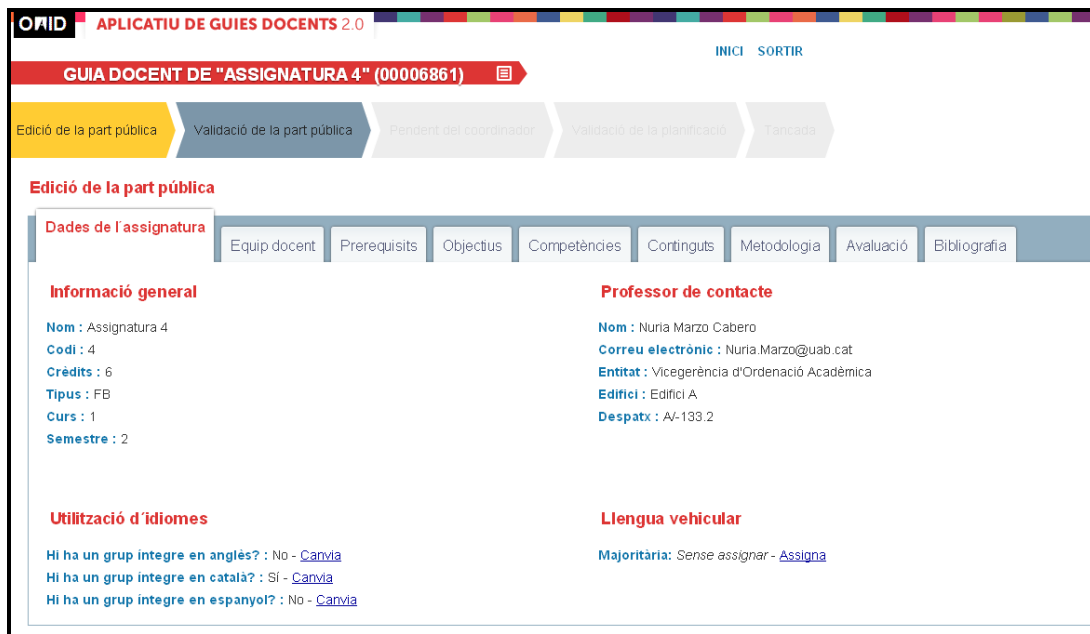
Figura 4: Vista dels camps editables de la guia docent AGD

Per poder realitzar correctament totes les accions definides al punt anterior, al GD s'han dissenyat una sèrie de rols per a cadascun dels agents del procés.