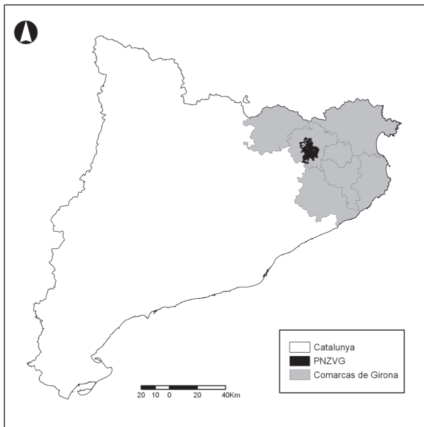
Mapa 1. Localización del Parque Natural de la Zona Volcánica de la Garrotxa.

del Bosque de Tosca como parque nacional. Pero estas iniciativas no recibieron un amplio apoyo social hasta 1975, cuando la sociedad catalana, en el marco del Congreso de Cultura Catalana, se moviliza mediante la campaña de Salvaguarda del Patrimonio Natural y reclama la protección de la zona volcánica (Mallarach y Riera, 1981; Boada, 1999). Esta movilización estuvo motivada principalmente por la gran expansión que, sobre esta zona natural, se venía haciendo por parte de los núcleos urbanos, así como por la intensa e incontrolada explotación de los piroclastos volcánicos por parte de empresas mineras, especialmente en el emblemático volcán Croscat, de gran interés científico, por ser el último que estuvo activo en la península Ibérica (Mallarach, 1998).