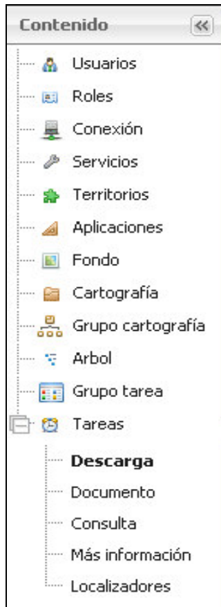
Imagen 1: Tabla de contenidos del administrador de SITMUN2