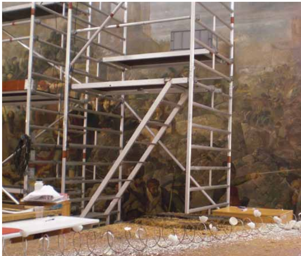
■ Procés de restauració del quadre al Centre de Restauració de Béns Mobles de Catalunya.

relacionats amb aquest episodi: Les heroïnes de Girona (1868), que es troba a la Diputació de Girona, pintat poc després del gran quadre, i La Companyia de Santa Bàrbara (1891), que es troba al Museu Nacional d'Art de Catalunya, pintat ja a les acaballes de la seva vida.