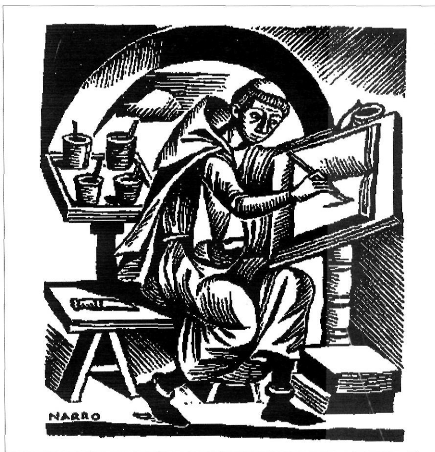
Il·lustració de Josep Narro per a La vida de l'artista medieval , de Frederic-Pau Verrié, 1953.

Frederic-Pau Verrié i Faget és membre de moltes institucions acadèmiques i d'estudi o de protecció patrimonial de Catalunya i d'altres països europeus: en serveixen