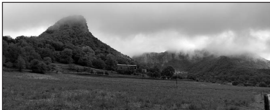
Vista general del mas Caselles amb els cingles de Cabrera al fons.

Hi ha dues diferències importants amb el pla de govern de la casa de Caselles: el perfil social dels receptors i la voluntat normativa del text. El Plan de Caselles s'adreça a una família que viu a pagès, en un mas, i que encara són pagesos, encara estan molt propers a l'explotació agrària; mentre que les Cuatro palabras apunta a aquells rendistes que han abandonat recentment el mas o s'estan urbanitzant. L'altra diferència substancial és que les Cuatro palabras no és un reglament, sinó un feix de consells i comentaris més o menys concrets i aplicables. No té una voluntat normativa tan definida. Tot plegat fa que el Plan general de gobierno econòmic y moral per la casa de Casellas pugui ser considerat un document excepcional.