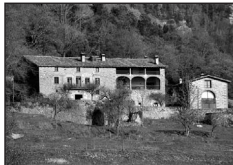
Imatge recent del mas Caselles.