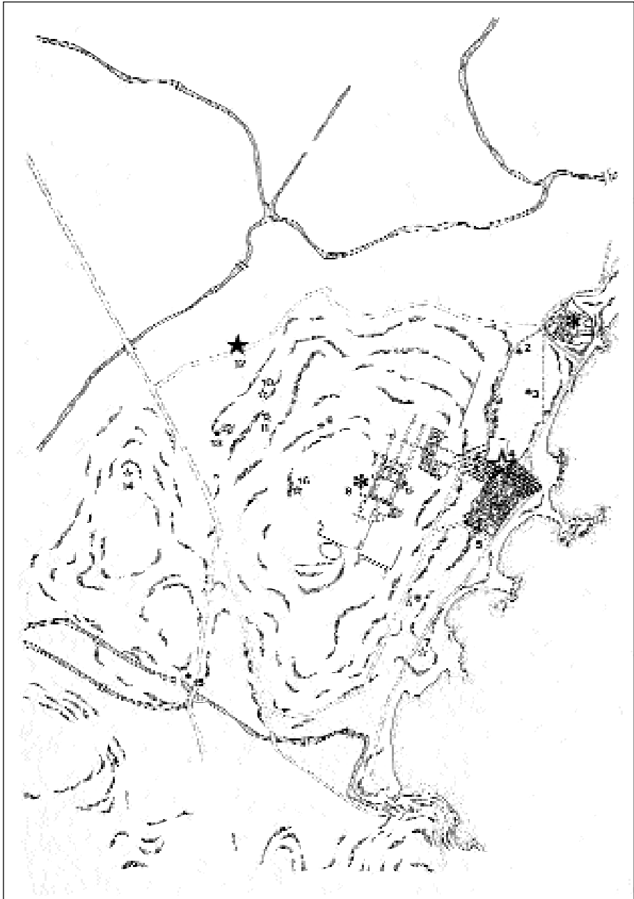
Figura 1. Empúries i els seus entorns. 1) Sant Martí d'Empúries. 2) Antic camí cap a la Neàpolis vorejant el port. 3) Port antic. 4) Cementiri tardà de la Neàpolis. 5) Cementiri tardà de la muralla meridional. 6) Necròpoli Bonjoan. 7) Muntanya dels Horts o Horts de la Palanca . 8) Ciutat regular. 9) Necròpoli Rubert. 10) Davant de Santa Margarida. 11) Necròpoli de ca l'Estruc. 12) Santa Margarida. 13) Santa Magdalena. 14) El Castellet. 15) Sant Vicenç. 16) Necròpoli Nofre.